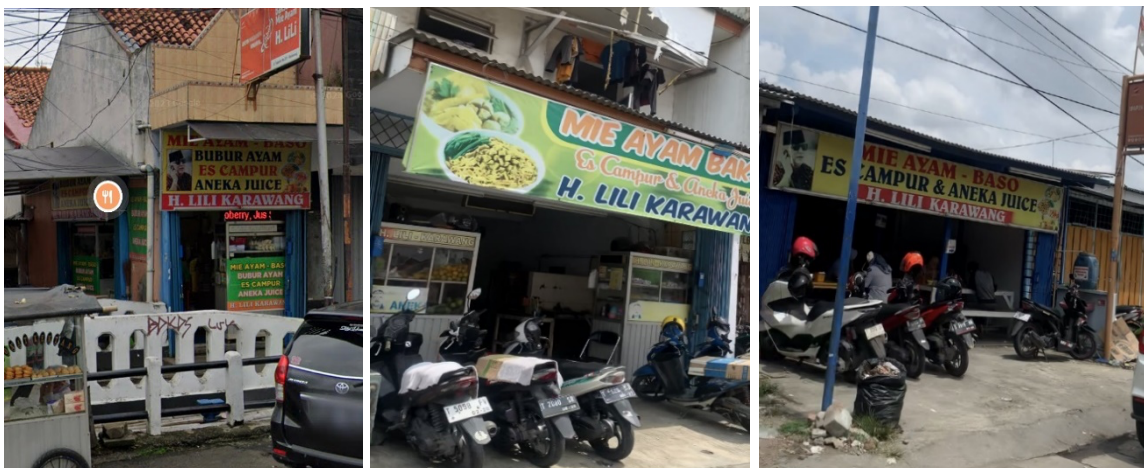
Gambar 2. Mie Ayam Baso H. Lili Karawang cabang Toko Baru, Gang. Rumput, dan Niaga

Setelah adanya penambahan pada tenaga kerja, usaha Mie Ayam Baso H. Lili Karawang mengalami peningkatan pada pendapatan yang dihasilkan.