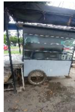
Gambar 3.6 Gerobak