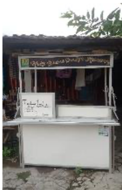
Gambar 3.4 Minibooth