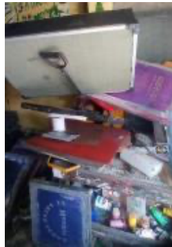
Gambar 3.2 Alat Set Sablon