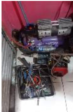
Gambar 3.1 Alat Set Bengkel