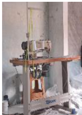
Gambar 3.5 Mesin Jahit