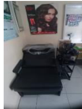
Gambar 3.3 Alat Set Salon