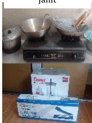
Gambar 3.8 Cooking Tools (Alat masak)