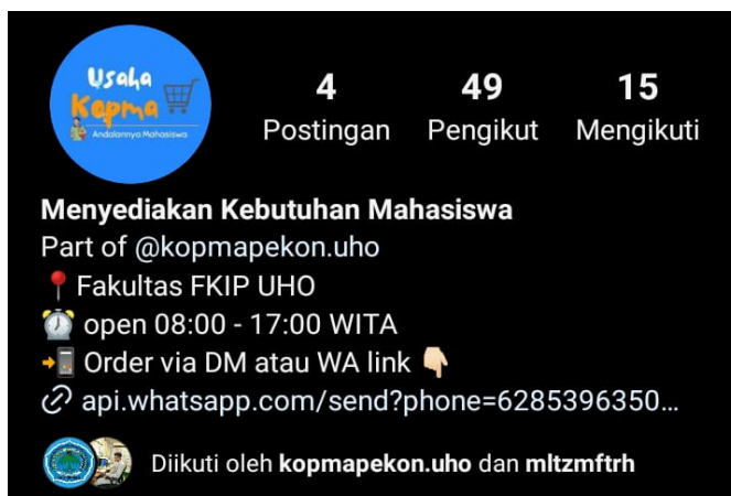
Gambar 2. Akun Instagram Untuk Pemasaran

Digitalisasi layanan merujuk pada penggunaan teknologi informasi dan komunikasi untuk menyediakan layanan yang lebih efisien, aksesibel, dan interaktif kepada anggota. Beberapa cara upaya digitalisasi layanan dapat berkontribusi dalam meningkatkan partisipasi anggota dalam koperasi: