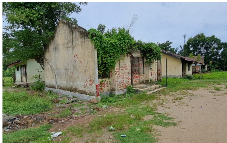
Gambar 3. Aset Tanah dan Bangunan yang Terlantar dan tidak termanfaatkan dengan baik di Kelurahan Batupanga Kabupaten Polewali Mandar Provinsi Sulawesi Barat