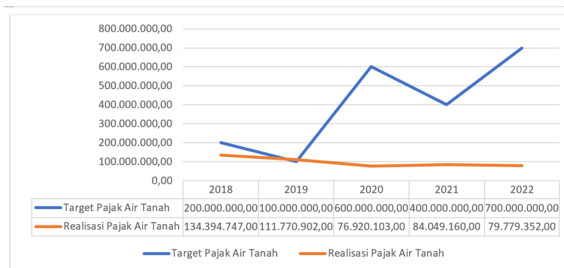
Gambar 2. Target dan Realisasi Pajak Air Tanah Kota Gorontalo 2018-2022