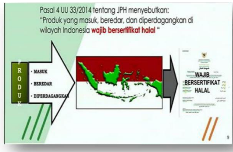
Gambar 3. Aliran JPH

Di Indonesia, sertifikasi halal adalah bentuk legal yang dikeluarkan oleh Lembaga Pengkajian Pangan Obat-obatan dan Kosmetika Majelis Ulama Indonesia (LPPOM-MUI) sebagai bentuk yang menyatakan bahwa suatu produk telah sesuai dengan syariat Islam. Sertifikat halal ini dapat digunakan untuk membuat label halal pada suatu produk (Razalli, et.al, 2013). Sebelum berlakunya Undang-Undang Nomor 33 Tahun 2014 tentang Jaminan Produk Halal, sertifikasi halal di Indonesia difasilitasi oleh Majelis Ulama Indonesia. Namun, semua berubah ketika Undang-Undang Nomor 33 Tahun 2014 membentuk Badan Penyelenggara Jaminan Produk Halal (BPJPH) sebagai lembaga resmi pemerintah di bawah Kementerian Agama yang memiliki otoritas dan kewenangan untuk menyelenggarakan jaminan produk halal di seluruh Indonesia. Sehingga kewenangan MUI dalam sertifikasi halal berfokus pada hal-hal yang berkaitan dengan sidang fatwa penetapan kehalalan produk (Harahap et al., 2022).