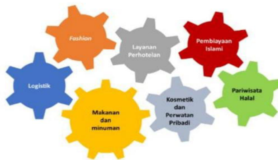
Gambar 1. Cakupan Industri Halal

Industri halal telah berkembang menjadi sektor manufaktur baru yang tumbuh bersama menjadi bisnis global dengan pertumbuhan tercepat di seluruh dunia. Hal ini sejalan dengan semakin banyaknya negara yang menerima konsep Halal sebagai salah satu faktor penentu kualitas suatu produk (Yakub et al., 2023).