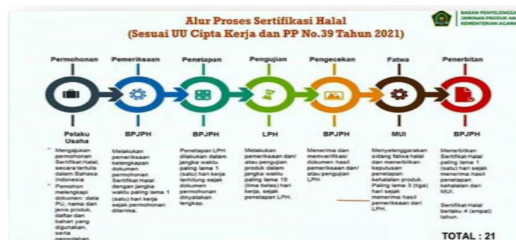
Gambar 4. Alur Sertifikasi Halal Alur Sertifikasi Halal