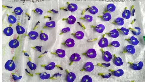
Gambar 1. Bunga Telang