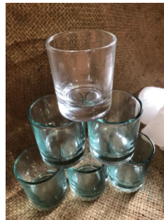
Gambar 2. Parafin