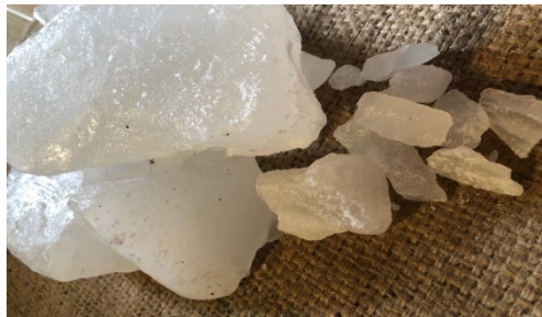
Gambar 3. Gelas Kaca

Hasil pengujian pewarna lilin dari bunga Telang ( Clitoria ternatea L.) yang telah dilakukan didapatkan bahwa pewarna bunga telang memberikan perubahan warna pada lilin aroma terapi dari parafin. Sehingga warna yang dihasilkan dalam pembuatan lilin aroma terapi bunga Telang ( Clitoria ternatea L.) ini berwarna biru keunguan. Warna fisik pada lilin menunjukkan bahwa tidak adanya perubahan warna selama penyimpanan dan pembakaran yaitu tetap menghasilkan warna biru keunguan karena menggunakan pewarna langsung dari ekstrak bunga Telang ( Clitoria ternatea L.) alami.