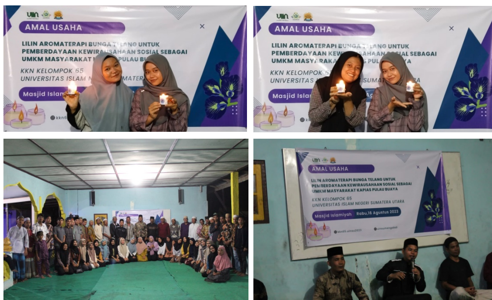
Gambar 4. Produk Lilin Aroma terapi Buatan Kelompok KKN 65 UINSU