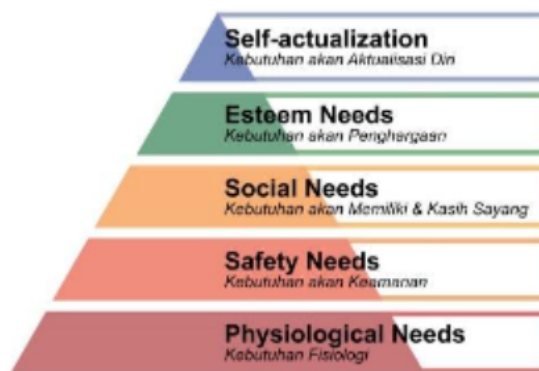
Gambar 1. Teori Hierarki Kebutuhan Mashlow

Perkembangan Affiliate Marketing di Indonesia mengalami kemajuan yang dipacu dengan adanya dampak negatif pada kegiatan perekonomian masyarakat ketika terjadi pandemi Covid-19. Pandemi ini memicu pembatasan sosial yang berdampak pada aktivitas ekonomi yang terhambat, dan menyebabkan banyak individu kehilangan pekerjaan serta menghadapi penurunan pendapatan yang signifikan (Alhazami, 2020). Selain itu meningkatnya biaya hidup di wilayah perkotaan membuat masyarakat merasa pekerjaan konvensional tidak lagi mampu memenuhi kebutuhan. Jakarta yang menjadi kota dengan biaya hidup tertinggi dibandingkan kota-kota lain di Indonesia berdasarkan survei BPS 2022, mencapai Rp14,88 juta per bulan dan diprediksikan akan terus meningkat (Harahap, 2024). Kondisi ini mendorong masyarakat, khususnya di wilayah perkotaan, untuk mencari alternatif pendapatan dalam memenuhi kebutuhan. Respons masyarakat dalam memenuhi kebutuhan ini sesuai dengan teori motivasi Mashlow yang menjelaskan motivasi manusia berdasarkan hierarki kebutuhan yang disusun ke dalam lima hierarki berbentuk piramida (Safrizal, 2022).