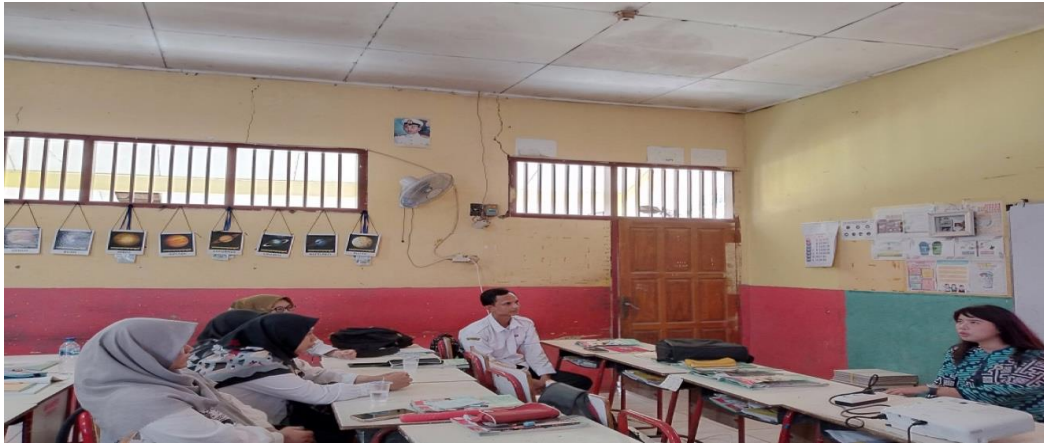
Gambar 2. Kondisi Penyuluhan Hukum kepada Guru SDN Cibatu 02 secara Tatap Muka dan Ditambah dengan Sarana Media Elektronik serta Media Sosial untuk Simulasi Kekerasan terhadap Siswa