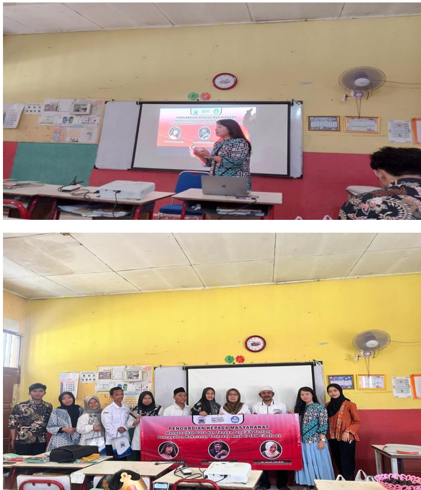
Gambar 3. Aktivitas Pelaksanaan Penyuluhan Hukum kepada Guru SDN Cibatu 02