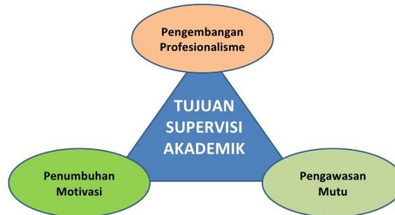
Gambar 1 Tiga Tujuan Supervisi Akademik

Negley menegaskan bahwa supervisi akademik bertujuan untuk meningkatkan kualitas akademik yang dilaksanakan guru (Rodliyah, 2014). Glickman