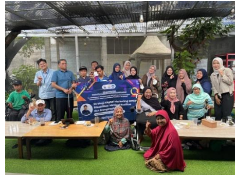
Gambar 4. Pelatihan Digital Marketing (30 Oktober 2025)