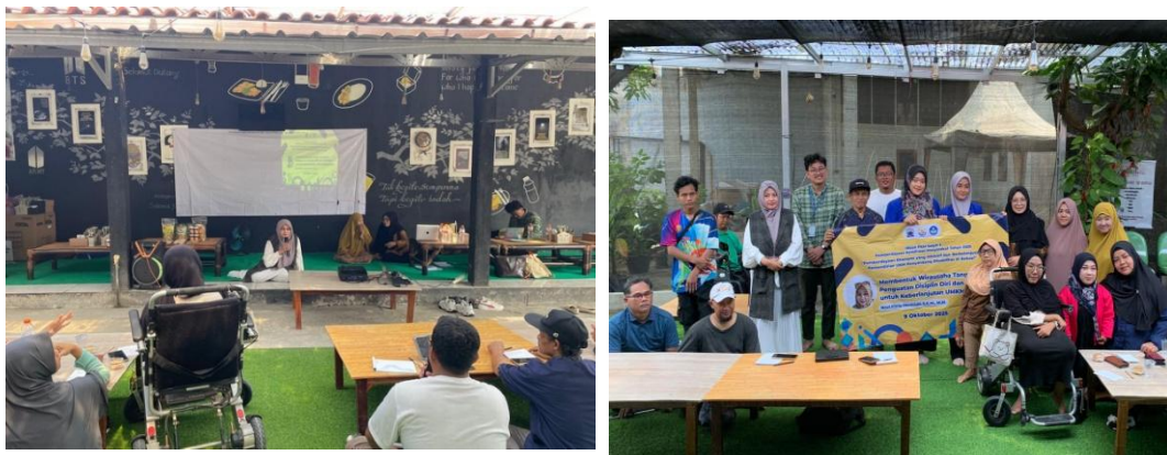
Gambar 1. Pelatihan Menjadi Wirausaha Tangguh (9 Oktober 2025)