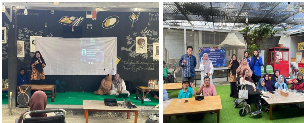
Gambar 2. Pelatihan Manajemen UMKM (16 Oktober 2025)