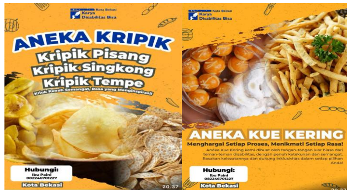
Gambar 3. Citra merk (Nilai Jual) “Karya Disabilitas Bisa”

Produk yang dihasilkan memiliki Label dengan Brand yang mudah diingat