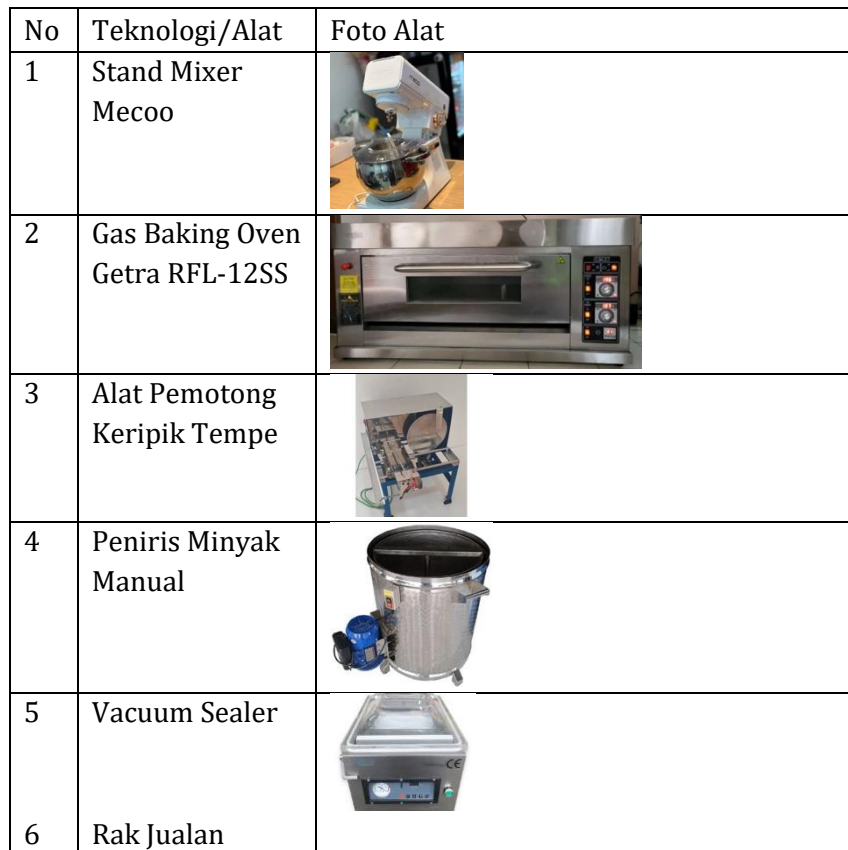
Tabel. 1 Produk Alat Teknologi Produksi

Berikut beberapa lampiran produk teknologi fisik