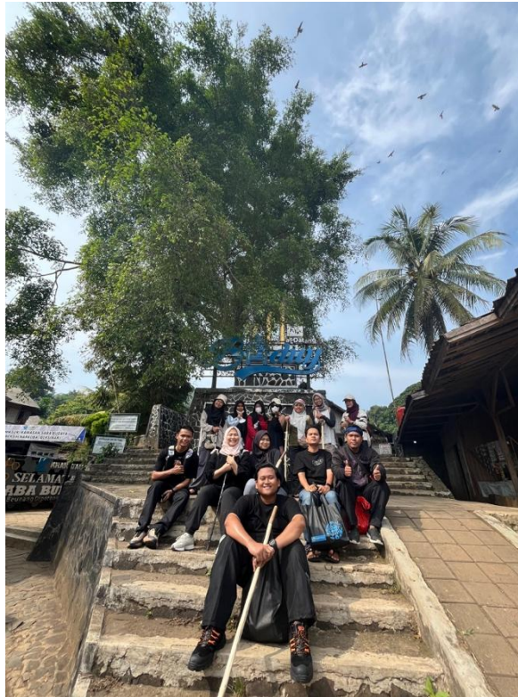
Gambar 1. Lokasi Kegiatan Kunjungan Edukatif

Berdasarkan kondisi tersebut, permasalahan utama yang diangkat dalam penelitian ini adalah belum optimalnya penerapan experiential learning sebagai sarana penguatan empati sosial melalui kegiatan edukatif bersama masyarakat adat.