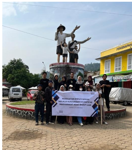
Gambar 2. Sesi Pembukaan Kegiatan di Kawasan Perbatasan Baduy Luar

Pada hari pelaksanaan, peserta tiba di kawasan perbatasan Desa Kanekes dan disambut oleh perwakilan masyarakat adat. Kegiatan dimulai dengan sesi pembukaan, kegiatan ini menjadi momentum penting yang menandai dimulainya rangkaian pelatihan dan pendampingan mahasiswa dalam program penguatan empati sosial. Pada kesempatan tersebut, dosen pendamping memberikan pengarahan lapangan yang berfokus pada tujuan kegiatan, prinsip etika berinteraksi dengan masyarakat adat, serta tata cara yang harus dijaga selama berada di lingkungan Baduy Luar.