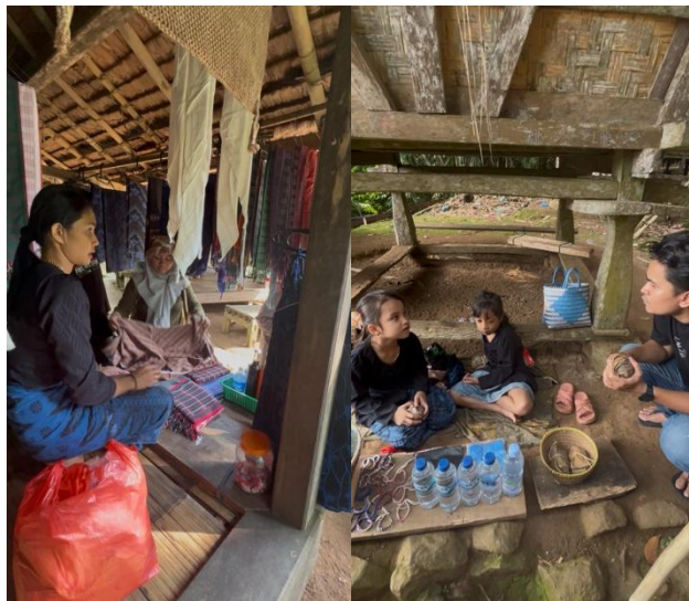
Gambar 3. Interaksi Mahasiswa dengan Masyarakat Adat Baduy Luar

Mahasiswa berdialog dengan tokoh masyarakat Baduy Luar di lingkungan permukiman adat. Interaksi ini menjadi sarana pembelajaran langsung bagi peserta untuk memahami nilai kesederhanaan, kebersamaan, serta kearifan lokal masyarakat Baduy.