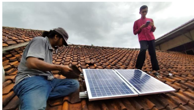
Gambar 2. Pemasangan panel surya

Keterlibatan santri dalam pengoperasian dan pemeliharaan SHS Box memberikan nilai tambah edukatif. Santri tidak hanya menjadi pengguna teknologi, tetapi juga subjek pembelajaran kontekstual mengenai energi terbarukan dan keberlanjutan lingkungan. Pendekatan ini memperkuat konsep eco-pesantren yang mengintegrasikan nilai keagamaan, teknologi, dan kepedulian lingkungan secara simultan.