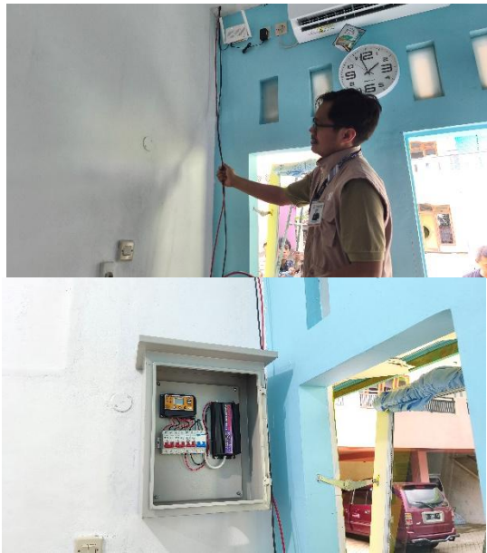
Gambar 3: Penarikan kabel untuk SHS Box, Gambar 4: SHS Box di ruang administrasi

Adapun dampak dari kegiatan ini menghasilkan implikasi nyata dari pelaksanaan program pengabdian kepada masyarakat yang mengintegrasikan digitalisasi data santri dan pemanfaatan energi terbarukan dalam manajemen pesantren. Secara kuantitatif, digitalisasi data santri memberikan peningkatan efisiensi kerja administrasi hingga 70–85%, terutama pada proses pencarian dan pembaruan data. Penurunan waktu kerja administratif berdampak langsung pada efektivitas pengelolaan pesantren, memungkinkan pengelola memfokuskan waktu pada kegiatan pembinaan dan pendidikan santri.