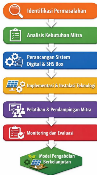
Gambar 1: Alur metodologi kegiatan pengabdian kepada Masyarakat penelitian

Berikut adalah alur metodologi kegiatan pengabdian kepada masyarakat