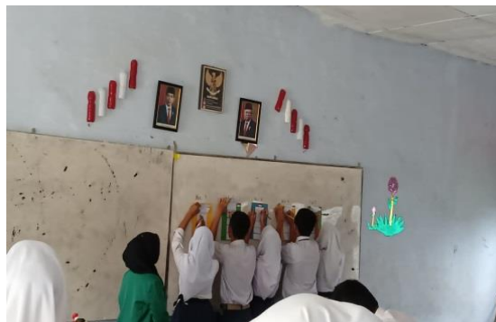
Gambar 4. Siswa menjawab pertanyaan di papan tulis

Kemudian, sesuai dengan aba-aba yang diberikan oleh guru, siswa secara bergantian satu persatu untuk menjawab pertanyaan yang ada di papan tulis sesuai dengan kelompoknya masing-masing.