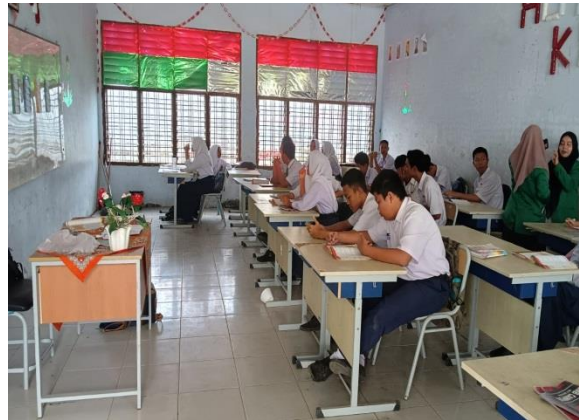
Gambar 2. Siswa membaca buku

Setelah guru memberikan apersepsi, kemudian siswa dibagi menjadi beberapa kelompok-kelompok kecil. Kelompok belajar ini terdiri dari 4-5 orang, yang nantinya kelompok tersebut akan melakukan diskusi. Menurut Asmuri, cara pembelajaran kelompok memiliki prinsip untuk mencapai tujuan bersama mempelajari materi pelajaran yang telah ditetapkan untuk diselesaikan secara bersama-sama. (Asmuri, 2014: 151). Setelah dibagi menjadi beberapa kelompok kecil, siswa kemudian menganalisis buku pendukung dalam pembelajaran dengan membaca materi yang dibahas.