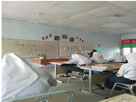
Gambar 1. Penjelasan materi oleh guru

Setelah guru memberikan apersepsi, kemudian siswa dibagi menjadi beberapa kelompok-kelompok kecil. Kelompok belajar ini terdiri dari 4-5 orang, yang nantinya kelompok tersebut akan melakukan diskusi. Menurut Asmuri, cara pembelajaran kelompok memiliki prinsip untuk mencapai tujuan bersama mempelajari materi pelajaran yang telah ditetapkan untuk diselesaikan secara bersama-sama. (Asmuri, 2014: 151). Setelah dibagi menjadi beberapa kelompok kecil, siswa kemudian menganalisis buku pendukung dalam pembelajaran dengan membaca materi yang dibahas.