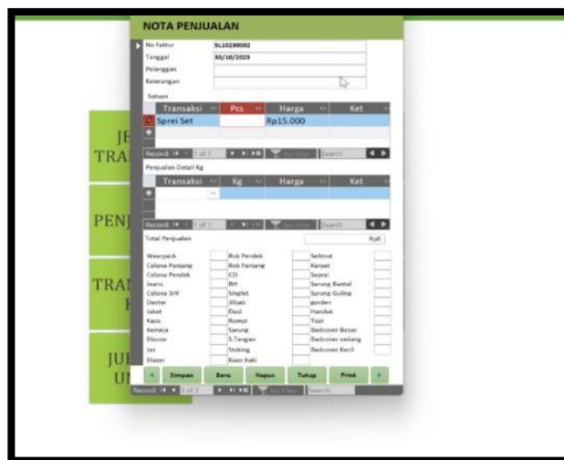
Gambar 2. Tampilan Laporan Penjualan

Jurnal umum menjadi menu terakhir yang memungkinkan pengguna untuk mencatat transaksi ke dalam buku besar secara sistematis, memberikan gambaran yang terorganisir tentang aktivitas keuangan perusahaan. Dengan desain antarmuka yang intuitif dan menu yang terstruktur, aplikasi ini tidak hanya memberikan kemudahan dalam penggunaan tetapi juga membantu Lamoela Bar dalam menjalankan dan memantau kegiatan operasional dan keuangan mereka dengan lebih efisien.