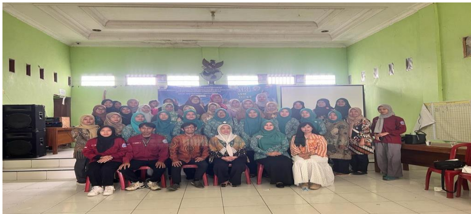
Gambar 2. Proses kegiatan Pengabdian Kepada Masyarakat

Dinamika proses penyuluhan melalui ceramah ini juga menunjukkan bahwa ada banyak isu yang harus disuarakan oleh audiens yang mana juga adalah praktisi yang bergerak di bidang pendidikan. Dari pemaparan-pemaparan terkait literasi hukum terutama mengenai hak perempuan dalam keluarga kurang lebih diharapkan dapat menciptakan kesadaran mengenai makna akan pentingnya literasi hukum tersebut dalam kehidupan sehari-hari.