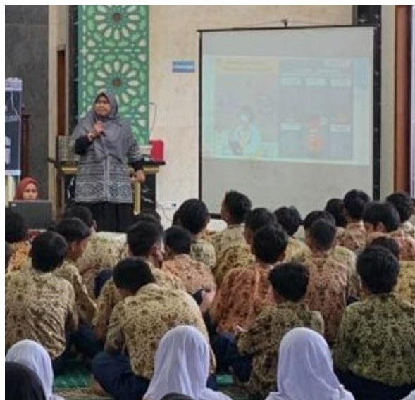
Gambar 1. Penanaman kesadaran tentang pentingnya kesehatan mental kepada remaja

Kelompok remaja adalah masa yang rentan dalam tahapan kehidupan manusia karena pada usia remaja memiliki pemikiran yang labil dan masa yang dialami dianggap penuh dengan tuntutan, tekanan dan masalah lainnya. Sehingga apabila remaja tidak mempunyai tujuan yang jelas dan bingung tentang identitas jati dirinya maka mudah mengalami masalah kesehatan mental. Pelayanan kesehatan mental sebagai upaya yang harus dilakukan sedini mungkin pada remaja dimulai dengan dengan screening atau deteksi dini kesehatan mental/psikososial, Melakukan upaya tindak lanjut screening berupa edukasi kesehatan mental maupun stimulasi perkembangan psikososial remaja baik pada remaja dengan perkembangan psikososial yang normal maupun yang menyimpang (mengalami kebingungan peran atau identitas diri remaja). Mengembangkan dan membentuk identitas jati diri remaja membantu memiliki tujuan yang jelas untuk menjalani hidup dan terhindar dari pengaruh negative dari lingkungan sekitar. Kesehatan mental seseorang dapat berfluktuatif, tergantung dari faktor internal dan eksternal dalam kehidupan mereka. Maka, kesehatan mental terlihat sebagai yang dikategorikan ke dalam sehat jiwa atau sakit jiwa.(Mawaddah & Prastya, 2023).