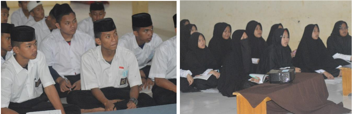
Gambar 2. Peserta Pelatihan Siswa-Siswi MA. Al-Lathifah

pengusaha sukses di masa depan. Melalui penerapan IPTEK dalam pelatihan ini, dapat memberikan pendekatan yang lebih sistematis, terukur, dan efektif dalam membentuk para wirausahawan muda. Dengan memiliki jiwa wirausaha, generasi muda dapat menciptakan lapangan kerja sendiri dan tidak hanya menjadi pencari kerja. Hal ini dapat mengurangi tingkat pengangguran dan kemiskinan di masyarakat. Para wirausahawan muda yang terlatih dapat menciptakan produk dan jasa baru yang dapat menggerakkan perekonomian lokal. Mereka juga dapat menjadi agen perubahan dalam komunitas mereka.