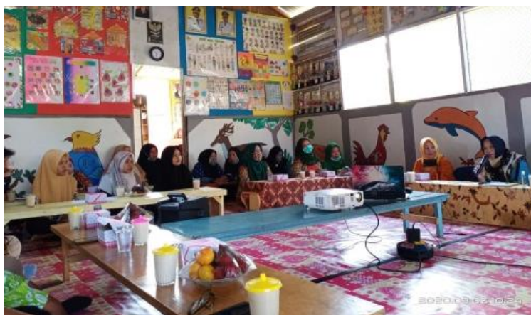
Gambar 2. Perencanaan Manajemen Sarana dan Prasarana

Hasil wawancara menunjukkan bahwa guru dan kepala sekolah bekerja sama dengan baik saat merencanakan sarana dan prasarana sekolah. Hasilnya menunjukkan bahwa guru dan kepala sekolah telah menyiapkan sarana dan prasarana sesuai dengan rencana awal. Tahap perencanaan ini dimulai dengan menentukan apakah akan ada pertemuan bersama orang tua, kepala sekolah, dan guru.