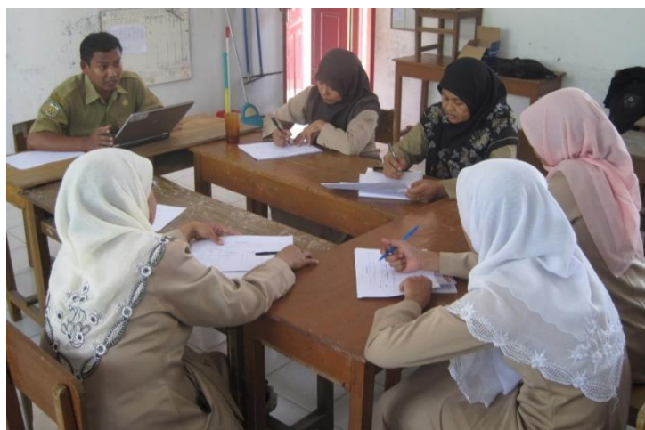
Gambar 4. Evaluasi Dewan Guru dan Kapala Sekolah

Evaluasi adalah cara untuk menentukan nilai tindakan yang telah dilakukan. Mengumpulkan data untuk digunakan dalam proses pengambilan keputusan dikenal sebagai evaluasi pendidikan. Hasil evaluasi menunjukkan bahwa program kegiatan harus dievaluasi, diperbaiki, dan disesuaikan agar sesuai dengan kebutuhan baru seperti PAUD Melati Karawang. Tidak diragukan lagi, evaluasi sistem dan infrastruktur harus dilakukan sebelum pengendalian dan pemantauan operasi sistem dan infrastruktur, yang memerlukan perbaikan sejumlah komponen. Berdasarkan hasil kegiatan, evaluasi pasti akan diperlukan untuk meninjau ulang, memperbaiki dan mengubah sistem untuk memenuhi kebutuhan baru. Ini juga berlaku untuk PAUD Melati Karawang. Pengawasan atau pemantauan harus dilakukan selama pelaksanaan sebelum menilai sarana dan prasarana, beberapa hal harus diperbaiki.