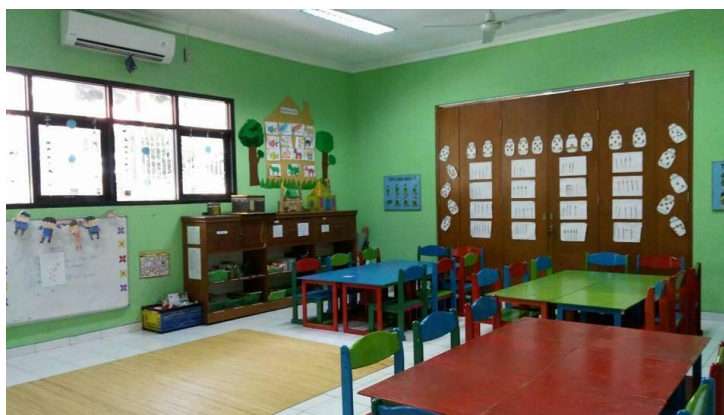
Gambar 3. Sarana dan Prasarana

Hasil wawancara menunjukkan bahwa PAUD Melati Karawang, memiliki sarana dan prasarana yang sangat terawat; barang-barang digunakan sesuai peraturan, dan setiap staf bertanggung jawab untuk memastikan bahwa fasilitas dan sarana tetap dalam kondisi baik. Dengan demikian, bahwa kegiatan pemeliharaan dilakukan dengan pembersihan, pemeriksaan rutinitas dan penyimpanan, tergantung pada kapasitas ruang. Kegiatan ini didasarkan pada data yang dikumpulkan dari catatan tentang perawatan prasarana dan fasilitas sekolah. Perawatan ini diberikan kepada sekolah setiap hari selama kegiatan untuk memastikan bahwa ia bertahan lama dan terjaga.