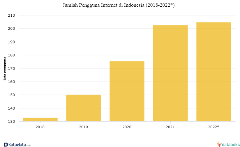
Gambar 1. Data Pengguna Internet 2018-2022

Saat ini kita berada pada daerah revolusi industri 4.0 yang di mana era tersebut merupakan era digitalisasi dan diikuti oleh kemajuan teknologi yang sangat pesat. Tentunya hal ini menuntut sumber daya manusia agar lebih kompeten dalam mengikuti era modernisasi agar tidak tertinggal dan terus mengikuti perkembangan zaman. Kemajuan teknologi yang pesat tentu akan menjadi wadah baru bagi masyarakat untuk dapat mengakses apapun dan di manapun dengan mudah. Selain untuk sarana komunikasi, perkembangan teknologi juga memudahkan masyarakat untuk mendapat informasi dengan cepat dan mudah agar tidak tertinggal. Masyarakat tentu sudah tidak asing dengan adanya unsur teknologi dan adanya akses internet di dalamnya sehingga teknologi dan internet Tentu dua hal yang tidak bisa dipisahkan untuk saat ini. Teknologi memang tidak semata-mata tentang internet tetapi faktanya masyarakat sudah mampu menguasai teknologi dengan adanya bantuan internet.