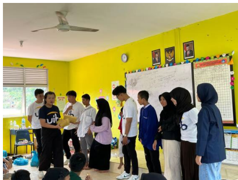
Image 3 Penyerahan Hadiah