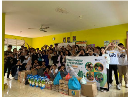
Image 4 Penyerahan Sembako dan Barang Sumbangan

Hasil konkret dari kegiatan ini meliputi :