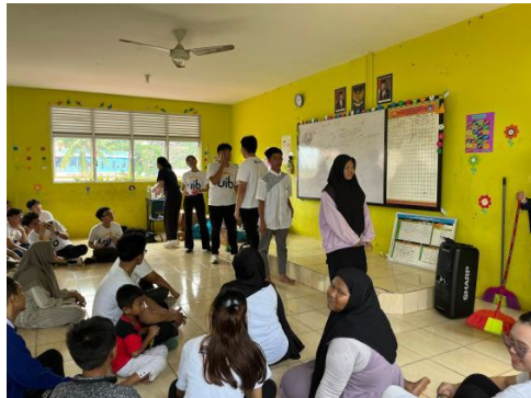
Image 2 Permainan Tebak Gaya