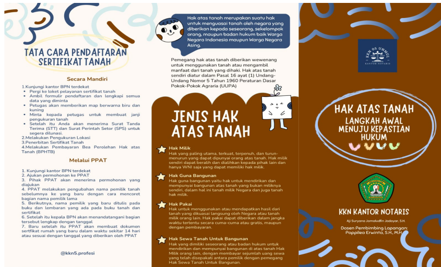
Gambar 2. Flyer Hak Atas Tanah Langkah Awal Menuju Kepastian Hukum

Kegiatan penyuluhan terkait erat dengan konsep “komunikasi”. Tanggapan masyarakat terhadap kategori hak atas tanah dan pentingnya penerbitan sertifikat hak atas tanah menjadi indikator keberhasilan kegiatan penyuluhan hukum terkait sertifikasi tanah. Mahasiswa KKN Non Reguler Kelompok 5 telah melakukan penyuluhan hukum sebagai respons dari masyarakat dalam hal ini. Inisiatif masyarakat untuk melakukan diskusi dan konsultasi hukum secara langsung dibuktikan dengan respons yang diterima oleh mahasiswa KKN kelompok 5 dari masyarakat terkait penyuluhan hukum.