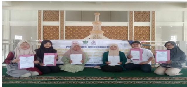
Gambar 7. Penyerahan NIB dan sertifikasi halal kepada pelaku UMKM yang menerima pendampingan pembuatan NIB dan sertifikasi halal

Kemudian kegiatan dilanjutkan dengan penyerahan Nomor Induk Berusaha (NIB) dan Sertifikasi Halal yang diserahkan kepada pelaku usaha UMKM.