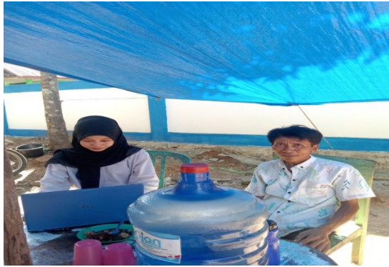
Gambar 5. Mendampingi pelaku usaha dalam pembuatan Nomor Induk Berusaha (NIB) serta mengisi data pelaku usaha di website SIINas dan SIHALAL

Setelah data pelaku usaha tercatat dalam akun sistem pendampingan produk halal (P3H), pendamping melalui proses pemeriksaan terhadap data yang diajukan oleh pelaku usaha. Dalam konteks ini, pendamping melakukan verifikasi langsung terkait dengan jenis bahan, yang digunakan dalam produksi produk yang akan dipasarkan oleh pelaku usaha, mulai dari tahap awal produksi hingga tahap akhir penyajian produk. Pendamping bertanggung jawab untuk memastikan kesesuaian bahan-bahan yang digunakan oleh pelaku usaha dengan informasi yang tercantum dalam pernyataan yang diajukan oleh mereka. Hal ini meliputi pengecekan terhadap kehalalan bahan yang telah dijamin dengan sertifikasi halal atau termasuk dalam daftar bahan yang terkecuali, dari persyaratan sertifikasi halal, sebagaimana diatur dalam keputusan Menteri Agama Nomor 1360 Tahun 2021. Upaya ini dilakukan guna memastikan bahwa seluruh bahan yang digunakan telah memenuhi standar kehalalan yang ditetapkan.