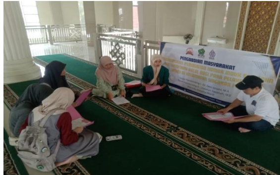
Gambar 6. Sosialisasi masa berlakunya NIB dan sertifikasi halal

Kemudian kegiatan dilanjutkan dengan penyerahan Nomor Induk Berusaha (NIB) dan Sertifikasi Halal yang diserahkan kepada pelaku usaha UMKM.