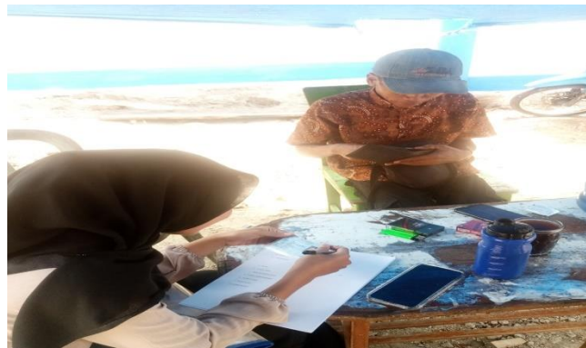
Gambar 3. Pendamping melakukan pendataan kepada Pelaku UMKM

Pada saat pengabdian berlangsung dilanjutkan dengan pendataan pelaku UMKM yang memenuhi kriteria nomor induk berusaha dan sertifikasi halal dan ketentuan lainnya yang sudah pendamping tetapkan.