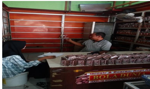
Gambar 2. Sosialisasi kepada pelaku usaha UMKM

Pada saat pengabdian berlangsung dilanjutkan dengan pendataan pelaku UMKM yang memenuhi kriteria nomor induk berusaha dan sertifikasi halal dan ketentuan lainnya yang sudah pendamping tetapkan.