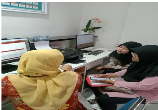
Gambar 4. Pendamping berkoordinasi langsung dengan DPMPTSP Kota Bengkulu

Tahap awal pendampingan dilakukan dengan membantu pelaku usaha dalam proses pembuatan Nomor Induk Berusaha, sebagai dari aspek legalitas usaha yang mereka jalankan. Dalam rangka ini, pendamping berinteraksi secara langsung dengan instansi terkait, yaitu Dinas Penanaman Modal dan Pelayanan Terpadu Satu Pintu (DPMPTSP) Kota Bengkulu, untuk memberikan bimbingan dalam proses tata cara pembuatan NIB tersebut.