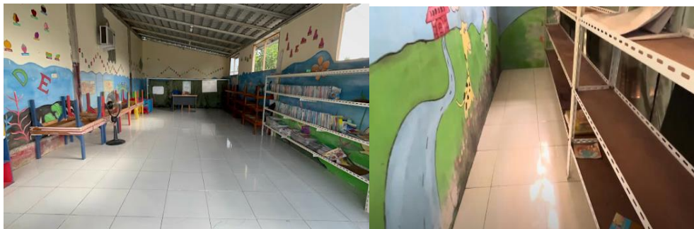
Gambar 3.5 Kondisi PAUD setelah dibersihkan