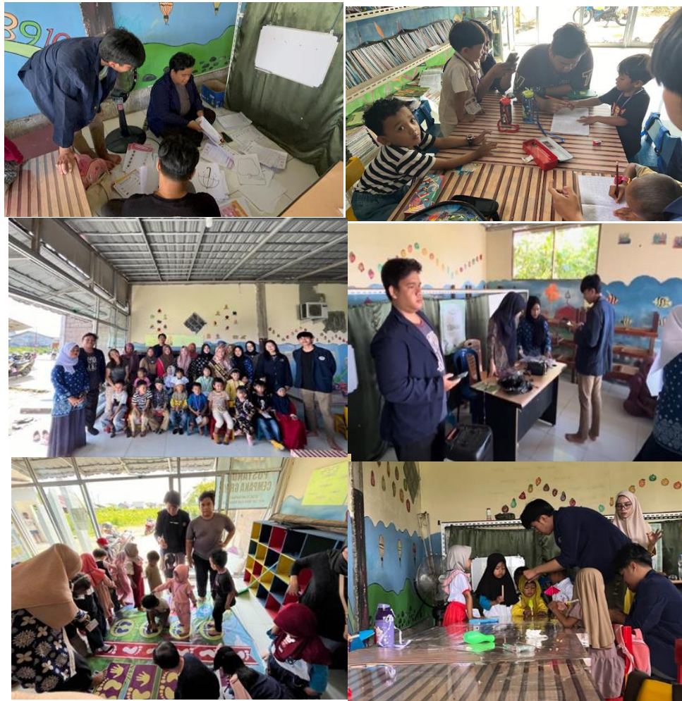
Gambar 4.2 Kegiatan aktivitas belajar-mengajar yang dilakukan mahasiswa kepada anak-anak