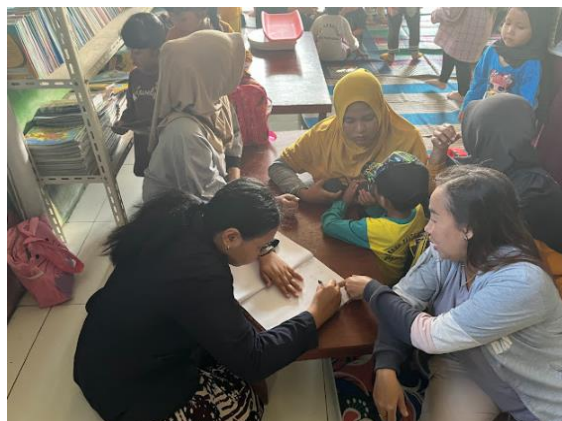
Gambar 4.3 Kegiatan mahasiswa membantu mendata bagi pada saat imunisasi Posyandu