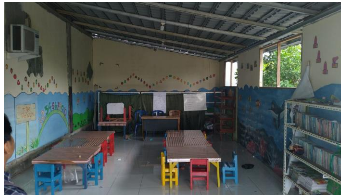
Gambar 3.1 Bagian Depan Ruang belajar PAUD

Berikut kondisi PAUD pada saat survei lokasi: