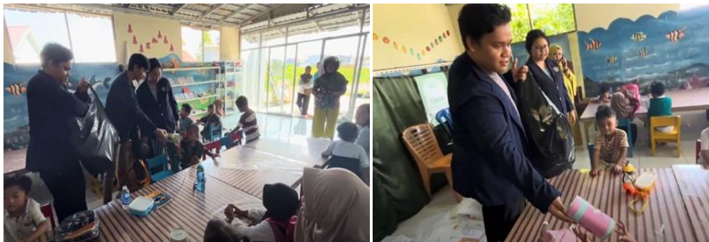
Gambar 4.4 Kegiatan mahasiswa sosialisasi tentang menabung dan membagikan celengan