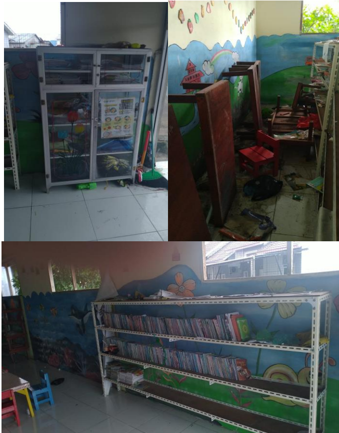
Gambar 3.2 Bagian Belakang PAUD dan Lemari Belajar