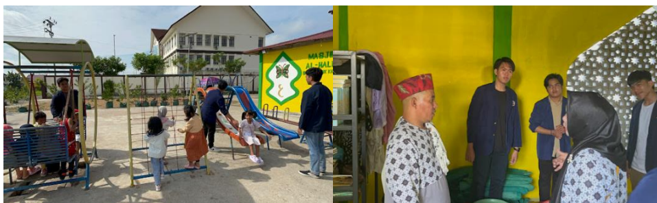
Gambar 4.1 Kegiatan bonding bersama anak-anak dan pengurus PAUD Al-Halim

Berikut adalah dokumentasi kegiatan Pengabdian kepada Masyarakat dalam rangka meningkatkan sistem pendidikan, kebersihan, dan kebiasaan menabung anak-anak di PAUD Al-Halim: