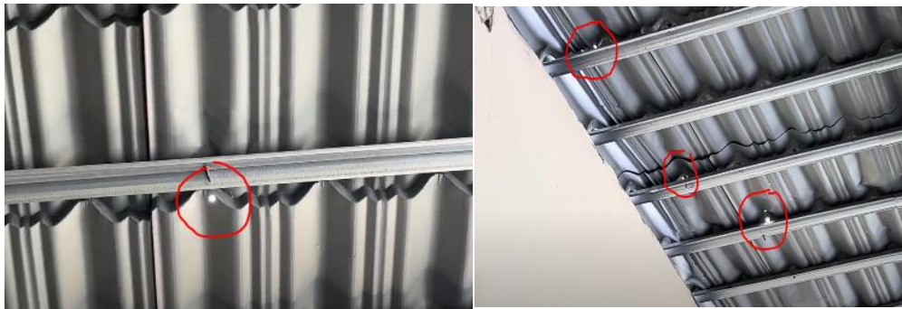
Gambar 3.3 Kondisi atap PAUD yang bocor