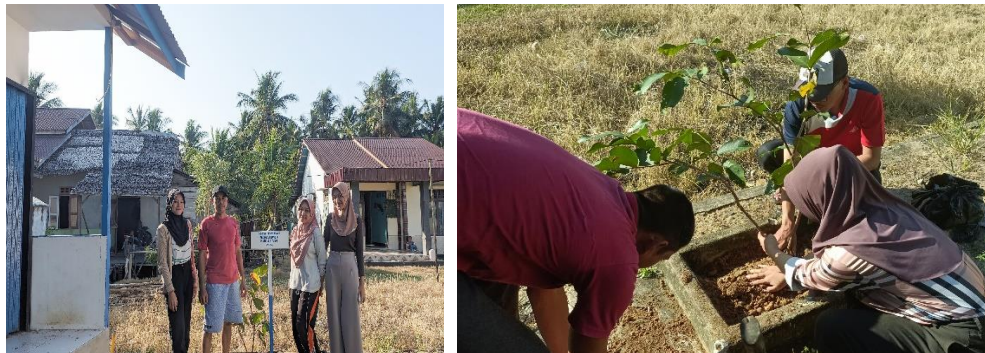
Gambar 3 Penanaman Pohon di Kantor Desa Masbangun

Kegiatan penanaman pohon ini sendiri merupakan inisiatif mahasiswa sebagai simbol kenang-kenangan kepada Desa Masbangun yang telah menerima dan membantu proses KKM-KKM kurang lebih satu bulan.