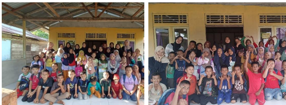
Gambar 1 Bimbingan Belajar Bahasa Inggris

melakukan pembelajaran tetapi kegiatan ini juga diselingi dengan mini games dan kerajinan tangan. Materi yang disampaikan juga materi yang mudah dipahami karena menggunakan kosakata yang digunakan pada kehidupan sehari-hari. Setelah mengikuti bimbingan, anak-anak menunjukkan kemajuan nyata dalam kemampuan bahasa Inggris mereka, seperti penghafalan dan pelafalan. Mereka juga menunjukkan keterampilan dalam berbicara, mendengarkan, membaca, dan menulis bahasa Inggris. Program ini meningkatkan rasa percaya diri siswa dalam menggunakan bahasa Inggris, membuat mereka lebih aktif. Dengan bimbingan ini, siswa tidak hanya menambah kemampuan berbahasa Inggris mereka tetapi juga menambah pengetahuan tentang keterampilan dalam membuat kerajinan tangan.