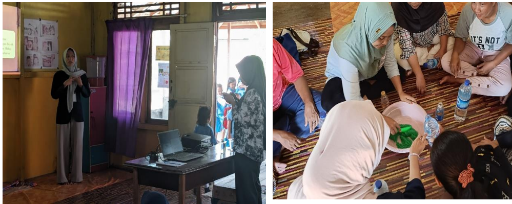
Gambar 2 Sosialisasi Bersama Masyarakat

rumah. Perubahan positif terlihat dari kebiasaan sehari-hari, seperti mencuci tangan sebelum makan dan setelah berkegiatan di luar rumah, serta partisipasi aktif dalam menjaga kebersihan lingkungan. Peningkatan kesadaran ini membantu mengurangi risiko penyebaran penyakit dan menciptakan lingkungan yang lebih sehat, yang mendukung kesehatan dan kesejahteraan secara keseluruhan. Untuk sosialisasi penggunaan gadget sendiri masyarakat di desa mulai menerapkan penggunaan gadget dengan lebih bijak. Mereka sadar akan risiko seperti gangguan penglihatan, masalah postur, efek buruk pada kualitas tidur, dan paparan konten yang tidak sesuai serta interaksi yang tidak sehat di dunia maya. Sehingga, masyarakat di Desa Masbangun telah mulai menggunakan strategi untuk memantau dan membatasi waktu layar anak-anak, menerapkan penggunaan gadget yang sehat dan seimbang. Dengan pendekatan ini, teknologi digital dapat dimanfaatkan untuk mendukung perkembangan anak-anak secara efektif, sambil mengurangi risiko potensialnya.