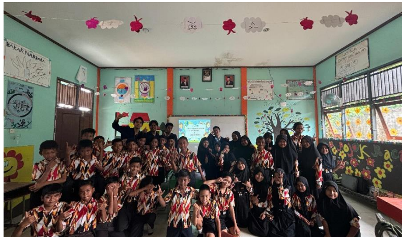
Gambar 6. Dokumentasi Kegiatan

Secara keseluruhan, kegiatan pengabdian masyarakat ini berhasil mencapai tujuan yang diharapkan, yaitu meningkatkan literasi keuangan dengan aplikasi dompet digital dan pemahaman tentang kewirausahaan di kalangan generasi Alpha di Desa Kepayang. Dengan meningkatnya pengetahuan dan keterampilan, diharapkan generasi muda ini dapat berkontribusi pada perekonomian lokal dan memanfaatkan teknologi digital secara optimal dalam usaha mereka. Penelitian lebih lanjut diperlukan untuk mengevaluasi dampak jangka panjang dari kegiatan ini terhadap perkembangan kewirausahaan di desa tersebut dan untuk mengidentifikasi faktor-faktor yang dapat mendukung keberlanjutan usaha yang dijalankan oleh anak-anak generasi alpha (Wiadi & Sajili, 2023)