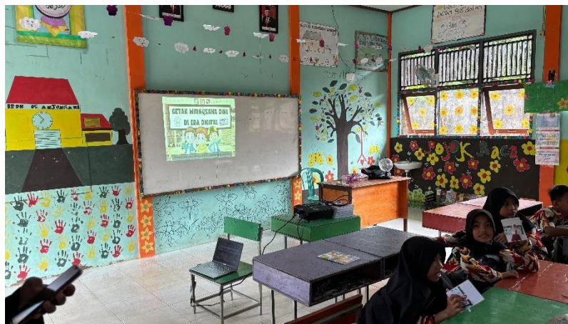
Gambar 2. Penyampaian Materi Wirausaha Sejak Dini

Program "Pengenalan Wirausaha Sejak Dini dan Aplikasi Dompot Digital (E-Wallet)" berhasil meningkatkan pemahaman dan keterampilan generasi alpha di Desa Kepayang, khususnya di Sekolah Dasar Negeri 05, dalam bidang kewirausahaan dan teknologi keuangan modern. Melalui serangkaian pelatihan dan sosialisasi, peserta tidak hanya memahami konsep dasar kewirausahaan, tetapi juga dilatih secara praktis untuk menggunakan dompet digital seperti OVO, Dana, dan Gopay sebagai alat transaksi yang relevan di era digital. Program ini mempersiapkan anak-anak untuk beradaptasi dengan perkembangan teknologi keuangan yang semakin pesat. Penelitian menunjukkan bahwa penggunaan dompet digital seperti DANA mengalami peningkatan signifikan di Indonesia, didorong oleh kemudahan akses dan fitur layanan yang menarik (Kandi et al. , 2024), sehingga pengenalan teknologi ini kepada generasi muda di daerah pedesaan menjadi langkah strategis dalam menciptakan generasi yang lebih melek teknologi dan siap menghadapi masa depan ekonomi digital