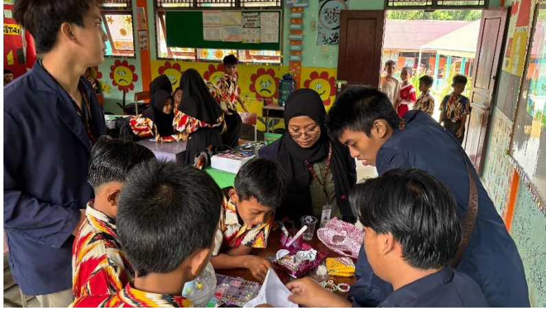
Gambar 3. Mempraktikkan Pembuatan Produk Usaha Kerajinan Tangan

wirausaha bukan hanya sekadar aktivitas ekonomi, tetapi juga melibatkan proses berpikir yang strategis dan kemampuan untuk melihat peluang di sekitar mereka.