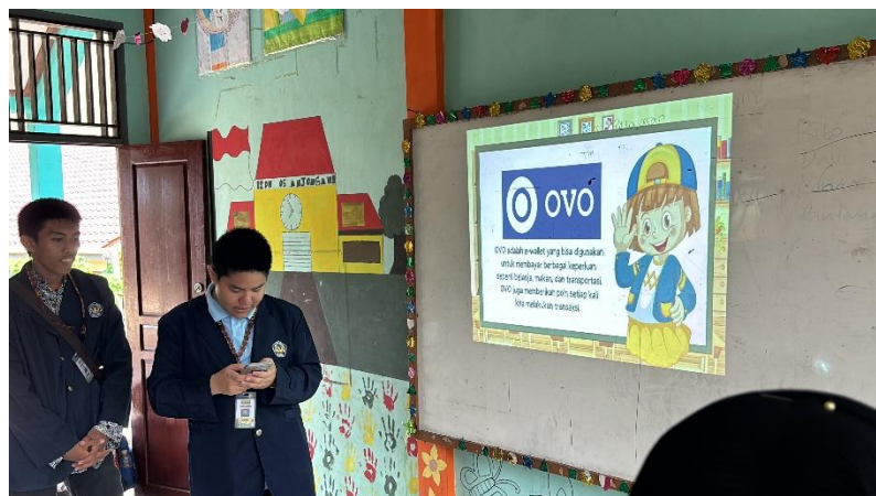
Gambar 4. Penyampaian Materi Dompot Digital

Selanjutnya, anak-anak diajak untuk lebih aktif dengan menggali ide-ide bisnis yang relevan dengan kehidupan sehari-hari mereka. Dalam sesi diskusi kelompok, mereka diminta untuk mengidentifikasi barang atau jasa yang dapat dikembangkan menjadi peluang bisnis. Kemudian, mereka diajak untuk melihat dan mempraktekan bagaimana kegiatan sederhana seperti membuat kerajinan tangan dengan manik-manik bahkan mendaur ulang barang-barang bekas dapat dijadikan peluang usaha yang nyata. Proses ini didukung oleh bimbingan dari fasilitator yang memastikan anak-anak dapat berpikir secara kreatif namun terstruktur, serta memahami langkah-langkah praktis dalam memulai usaha, seperti menentukan modal awal, mengelola keuangan sederhana, dan mempromosikan produk secara efektif.