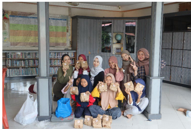
Gambar 7. Kegiatan Mengemas Lumpia Hasil Pemesanan Konsumen

Sebelum memulai dan menyelesaikan kegiatan pelatihan dan pendampingan kewirausahaan, Anak-anak panti diarahkan untuk mengisi pre-test dan juga post-test yang bertujuan untuk mengetahui tingkatan keberhasilan yang dihasilkan dari berbagai kegiatan pelatihan dan pendampingan kewirausahaan yang dilaksanakan. Dari Uji Paired Sample T-Test di SPSS, diketahui adanya pengaruh signifikan yang membedakan antara perlakuan pada hasil pre-test dan juga perlakuan pada hasil post-test yang terdiri dari aspek pengetahuan kewirausahaan dan jiwa kewirausahaan yang dimiliki Anak-anak panti. Hal ini membuktikan bahwa pelaksanaan pelatihan dan pendampingan pada kegiatan kewirausahaan berhasil menambah pengetahuan dan jiwa kewirausahaan yang dimiliki Anak-anak Panti Asuhan 'Aisyiyah Nur Fauzi.