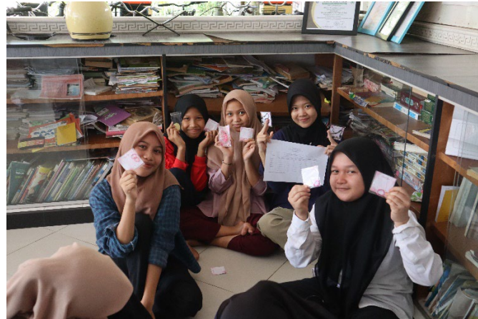
Gambar 6. Kegiatan Pengemasan Produk Aksesoris