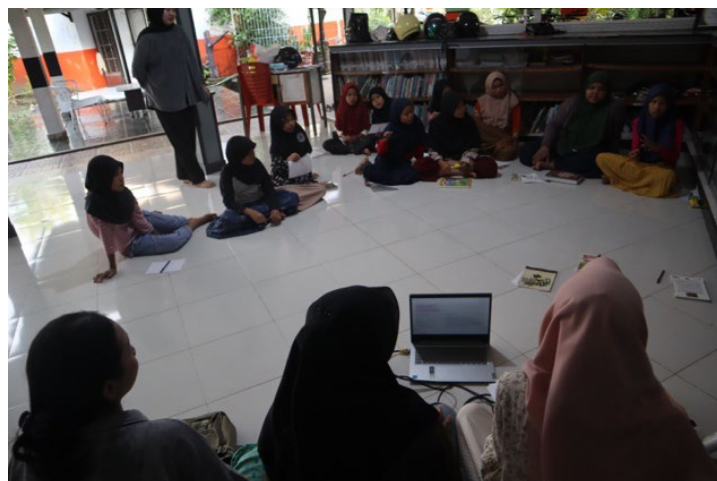
Gambar 2. Kegiatan Pelatihan dan Pendampingan Kewirausahaan