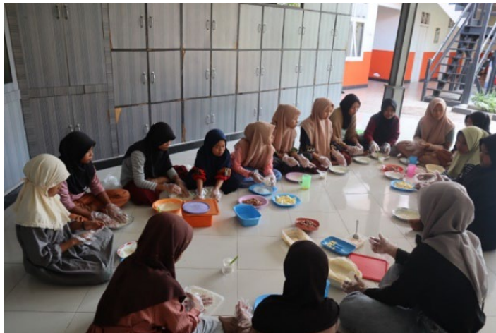
Gambar 4. Kegiatan Praktek Pembuatan Lumpia yang Kemudian Akan Dijual

Metode kedua yang dilakukan yaitu dengan menggunakan metode praktik. Metode praktik merupakan suatu metode dengan memberikan materi menggunakan suatu alat dan benda yang dilakukan untuk mengimplementasikan atau menerapkan teori dengan kondisi yang sesungguhnya melalui latihan, peragaan, dan praktik untuk mengembangkan suatu keterampilan (Aini et al., 2023). Metode praktik ini diberikan dalam bentuk pelatihan dan pendampingan. Metode praktik dilakukan pada kegiatan; Praktik kewirausahaan 1 (membuat aksesoris), Praktik kewirausahaan 2 (membuat lumpia), Praktik desain (menggunakan tools dasar pada aplikasi CANVA), Praktik pengemasan produk usaha, dan praktik penjualan produk (menjual aksesoris dan lumpia).