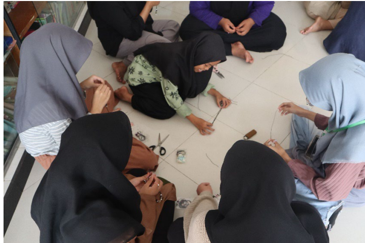
Gambar 5. Kegiatan Praktek Pembuatan Aksesoris

Pada awal dan akhir kegiatan Anak-anak Panti Asuhan 'Aisyiyah Nur Fauzi diarahkan untuk mengerjakan pre-test dan juga post-test . Tujuan dari pelaksanaan pre-test dan juga post-test tersebut adalah untuk mengetahui tingkatan pemahaman Anak-anak panti sebelum dan setelah mengikuti berbagai rangkaian kegiatan pelatihan kewirausahaan yang diadakan oleh anggota KKM-PKM Kelompok 10.