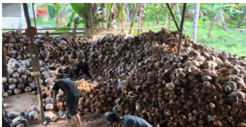
Gambar 1. Situasi Pabrik Kelapa di Desa Pasir Panjang

Salah satu upaya untuk mengurangi pencemaran lingkungan dengan mengelola sampah organik adalah mengubahnya menjadi cairan serbaguna menggunakan teknik fermentasi yang disebut Eco-Enzyme . Eco-Enzyme merupakan sampah atau limbah organik yang difermentasi menggunakan glukosa (seperti gula tebu, gula Jawa, dan gula aren) dan air dengan perbandingan 1:3:10 dan dibiarkan selama 90 hari. Eco-Enzyme menghasilkan enzim yang menjadi cairan bermanfaat dengan mempercepat reaksi biokimia alami dari limbah buah dan sayuran (Supriyani dkk., 2020). Cairan Eco-Enzyme dapat digunakan untuk pembersih seperti cairan pencuci piring dan dapat dimanfaatkan sebagai pupuk atau pestisida alami. Menurut (Nazim dan Meera, 2015), Eco-Enzym memiliki banyak manfaat seperti menyuburkan pertumbuhan tanaman organik, dapat digunakan untuk menjaga kesehatan ternak, membersihkan saluran, menjernihkan air, dan mengurangi limbah. Penerapan Eco Enzyme ditujukan mengurangi sebagian besar penumpukan di tempat pembuangan sampah (TPA) dengan dikelola, karena sampah yang terbuang di TPA merupakan limbah organik sebesar 70% (Manaf dkk., 2024).