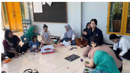
Gambar 5. Dokumentasi Penyampaian Materi Tentang Eco-Enzyme

Penerapan Eco-Enzyme merupakan upaya yang mudah dan murah untuk solusi ramah lingkungan. Eco-Enzyme dapat digunakan untuk mengurangi bahan kimia berbahaya dan bahan yang murah dan mudah ditemukan. Eco-Enzyme digunakan sebagai pengganti bahan kimia berbahaya misalnya pembersih rumah tangga, pupuk organik atau pestisida alami yang ramah lingkungan (Yulistiar & Manggalou, 2023). Dokumentasi penyampaian materi kegiatan Sosialisasi Eco-Enzyme disajikan pada Gambar 5 sebagai berikut: