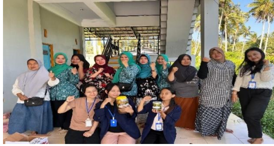
Gambar 7. Sesi Foto Bersama Tim Penulis dan Ibu PKK Peserta Sosialisasi Eco-Enzyme

Setelah Eco-Enzyme disimpan hingga 90 hari, ciri-ciri cairan yang berhasil akan menunjukkan warna coklat gelap atau cerah, dan berbau asam manis dengan jamur putih di permukaannya. Hasil fermentasi yang tidak berhasil ditunjukkan dengan aroma yang busuk dan timbul jamur hitam. Peserta mendapatkan wawasan tentang mengelola sampah organik menjadi Eco-Enzyme yang sangat bermanfaat bagi kehidupan sehari-hari. Kesadaran masyarakat terhadap manajemen lingkungan yang ramah terutama mengelola sampah organik dengan Eco-Enzyme meningkat, peserta yaitu Ibu PKK akan melakukan pembuatan Eco-Enzyme di rumah, karena bahannya mudah ditemukan dan prosesnya mudah dibuat, selain itu sangat bermanfaat sebagai pengganti pembersih rumah tangga, dan memiliki nilai ekonomis (Junaidi Rifqi Mohamaad dkk., 2021).