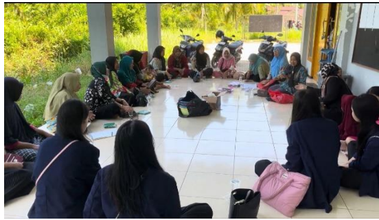
Gambar 3. Dokumentasi saat Melakukan Koordinasi dengan Ibu PKK Desa Pasir Panjang

Penulis melakukan koordinasi pada hari Sabtu, 20 Juli 2024 terkait izin kegiatan Sosialisasi Eco-Enzyme dan melakukan penyesuaian waktu beserta alat dan bahan yang harus dibawa dengan Ibu PKK untuk melakukan praktik cara membuat Eco-Enzyme . Sosialisasi Eco-Enzyme dilaksanakan pada hari Kamis, 25 Juli 2024 di halaman Kantor Desa Pasir Panjang yang dimulai pukul 14.00 WIB.