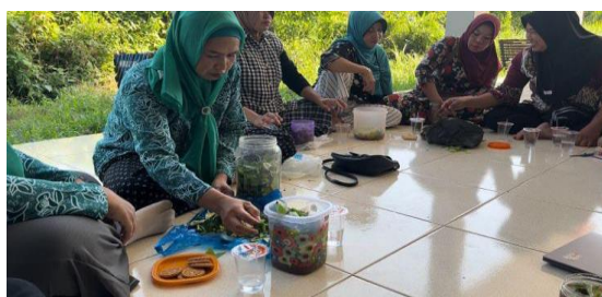
Gambar 6. Dokumentasi Praktek Pembuatan Eco-Enzyme

Setelah penyampaian materi, penulis menyiapkan gula merah dan memeriksa sisa sayuran dan buah yang dibawa oleh Ibu PKK dan memberi wawasan tentang limbah organik yang dapat digunakan dan tidak dapat digunakan untuk membuat Eco-Enzyme tersebut. Limbah organik yang tidak dapat digunakan adalah daun-daun kering, kulit buah keras, makanan berminyak, kertas, logam, dan bahan sulit terurai yang lainnya. Selanjutnya melakukan praktik pembuatan Eco-Enzyme dengan memasukkan bahan baku limbah organik (sisa sayuran atau kulit buah), gula dengan perbandingan 3:1:10 ke dalam toples atau wadah yang memiliki tutup kemudian dikocok. Toples ditulis tanggal pembuatan dan tanggal, proses fermentasi akan selesai yaitu sekitar 90 hari setelah tanggal pembuatan sehingga hitungan waktu jelas dan tidak terjadi keraguan saat Eco-Enzyme telah siap digunakan (Artiani dkk., 2024). Peserta harus mengingat untuk membuka toples setiap 3 hari sekali agar tidak menimbun gas di dalam toples. Dokumentasi praktik pembuatan Eco-Enzyme dan sesi foto bersama sebagai berikut: