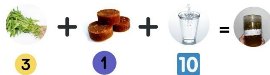
Gambar 4. Tahap Pembuatan Eco-Enzyme

Perbandingan Komposisi Bahan dalam Membuat Eco Enzyme