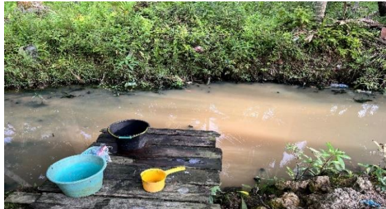
Gambar 2. Kualitas Air di Desa Pasir Panjang Mempawah

perkebunan kelapa yang menghasilkan kopra dan cocopeat. Ini membuat kualitas dan kebersihan air pada saluran air disana menurun akibat limbah sisa serabut kelapa yang ditumpuk.