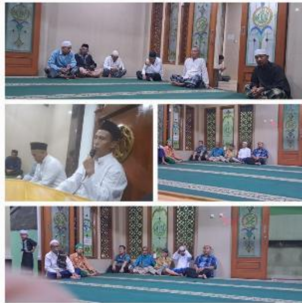
Gambar 2 Suasana Kegiatan Kajian Tazkiyatun Nafs Di Masjid Nurul Imam

Kegiatan pelaksanaan kajian tazkiyatun nafs dilakukan melalui pendekatan edukatif-transformatif dengan metode ceramah interaktif, studi kasus, praktik dzikir dan tafakur, serta refleksi spiritual. Materi kajian disusun dalam 8 tema utama, antara lain: (1) Konsep Tazkiyatun Nafs dalam Al-Qur'an dan Hadits, (2) Mengenal Diri dan Jiwa ( Nafs ), (3) Muhasabah dan Muraqabah, (4) Sabar dan Syukur dalam Kehidupan, (5) Terapi Dzikir dan Tadabbur, (6) Mengelola Emosi dalam Islam, (7) Jiwa yang Tenang ( Nafs al-Muthmainnah ), dan (8) Membangun Komunitas Rohani. Setiap pertemuan berlangsung selama 90 menit dengan pembagian 45 menit pemaparan materi, 30 menit diskusi, dan 15 menit praktik dzikir atau tafakur.