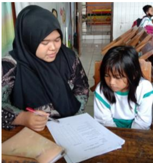
Gambar 1. Wawancara Peserta Didik

Hasil observasi tentang profiling gaya belajar peserta didik, akan dijadikan sebagai patokan guru dalam menentukan dan merancang pembelajaran yang sesuai dengan hasil profiling peserta didik di kelas IB SD Negeri gayamsari 02 Semarang. Adapun tujuan dari penelitian ini adalah: (1) untuk membuat pemetaan gaya belajar peserta didik pada rancangan pembelajaran di kelas IB SDN Gayamsari 02 Semarang (2) mendesain rancangan pembelajaran yang sesuai dengan hasil observasi profiling peserta didik di kelas IB SD Negeri Gayamsari 02 Semarang.