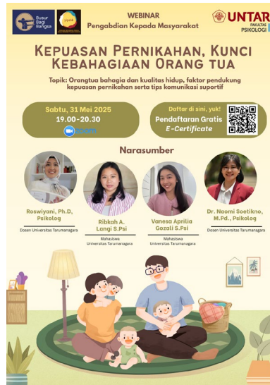
Gambar 1 Poster Undangan Webinar