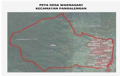
Gambar 2. Peta Lokasi Pelaksanaan Abdimas, Desa Warnasari, Pangalengan, Kabupaten Bandung, Jawa Barat

SD Palayanan, Desa Warnasari yang berada di Jl. Raya Situ Cileunca No. 06 Cibeunying, RT. 02 RW. 09, Pangalengan, Kabupaten Bandung, Jawa Barat.