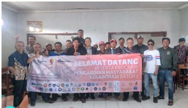
Gambar 10 Foto Bersama Pelaku Usaha Pariwisata Desa Cileunca Kec. Pangalengan

Kegiatan penutup dilakukan dengan pemberian giveaway bagi peserta pelatihan, Foto bersama dengan peserta Pelatihan serta pembuatan laporan kegiatan pengabdian masyarakat.