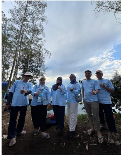
Gambar 11 dan 12 Tim Abdimas berkunjung ke salah satu tempat wisata rafting di Situ Cileunca Desa Warnasari Kec. Pangalengan Kabupaten Bandung yang sangat populer dikalangan wisatawan domestik maupun mancanegara. Selain berpetualangan dengan arus air situ cileunca, tempat wisata ini disuguhi pemandangan kebun teh dan sayuran dikaki Pegunungan Malabar yang sangat indah.