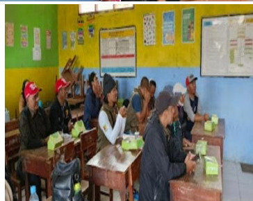
Gambar 7,8 dan 9 Kegiatan Sosialisasi dan Edukasi Mengenai Konsep Pariwisata Halal