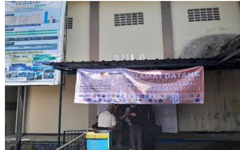
Gambar 3. Lokasi Pelaksanaan Abdimas, Aula Desa Warnasari, Pangalengan, Kabupaten Bandung, Jawa Barat