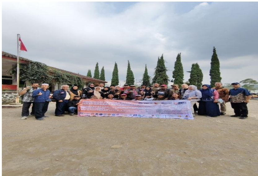
Gambar 4 Lokasi Pelaksanaan Abdimas, Lapangan Sekolah Dasar (SD) Palayanan Desa Warnasari, Pangalengan, Kabupaten Bandung, Jawa Barat