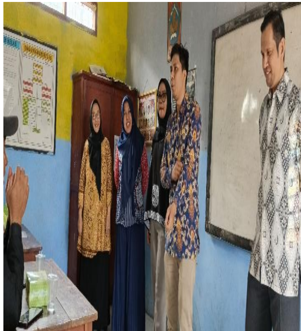
Gambar 5 dan 6 Perkenalan Tim Abdimas