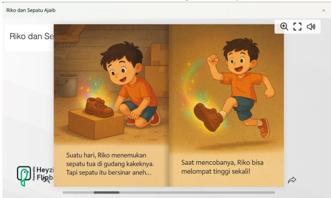
Gambar 6. Contoh Produk Buku Digital Hasil Pelatihan

melalui tautan digital. Contoh buku cerita yang dihasilkan berjudul “Riko dan Sepatu Ajaib”, “Peta Rahasia Anak Hebat”, dan “Malika dan Uang Kembaliannya”.