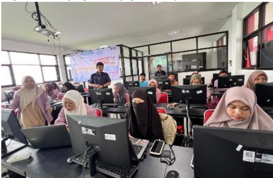
Gambar 3. Sosialisasi dan Pelatihan Layouting Buku Digital

Peserta dilatih membuat narasi visual menggunakan Canva, termasuk pemilihan ilustrasi yang ramah anak, pengaturan tipografi, dan layout halaman cerita.