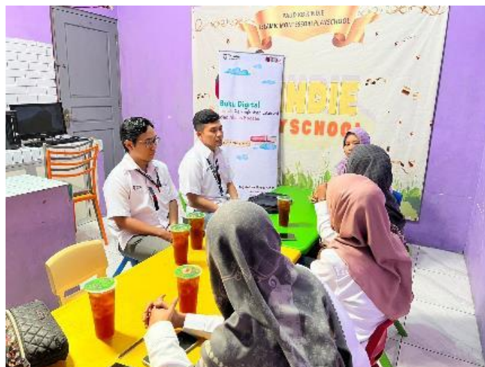
Gambar 1. Diskusi Terkait Kebutuhan dan Identifikasi Masalah

Tim pengabdian melakukan observasi awal dan diskusi dengan pengelola Kinder Club untuk mengidentifikasi kebutuhan dan kendala yang dihadapi dalam penyediaan bahan bacaan.