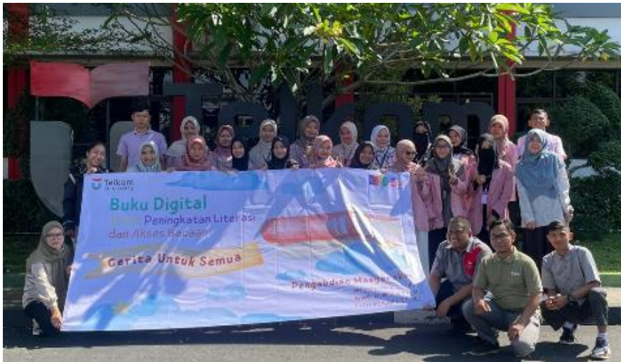
Gambar 2. Sosialisasi dan Pelatihan Literasi Dasar

Pendidik dibekali dengan teknik menggali ide cerita dari pengalaman anak sehari-hari, nilai-nilai moral, dan isu lingkungan sekitar. Pendekatan ini menggunakan metode diskusi kelompok dan brainstorming terarah. Pendidik juga dibekali dengan Teknik dan pengetahuan tentang literasi dasar bagi anak-anak yang sesuai dengan tahapan tumbuh kembangnya.