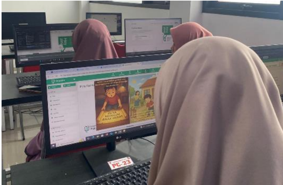
Gambar 4. Proses Publikasi Buku Digital ke dalam Platform Heyzine