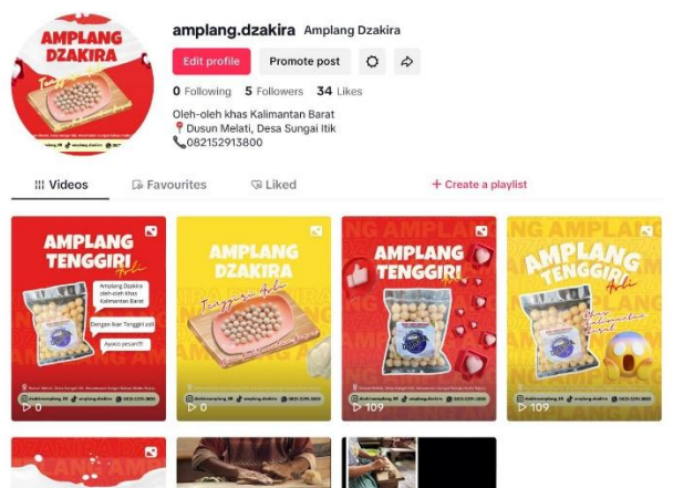
Gambar 3.4 Akun TikTok Amplang Dzakira

Perubahan pola pikir juga terlihat dari kesiapan pelaku usaha memanfaatkan kanal digital baru. Ibu Nurida, pemilik Amplang Dzakira, yang sebelumnya mengandalkan Facebook dan WhatsApp, kini mulai akan mengeksplorasi TikTok Live sebagai sarana promosi interaktif. Ibu Desi (PGSM Snack) dan Kak Pau menunjukkan antusiasme dalam pencatatan keuangan setelah menerima materi tambahan dari program SICAGAK (Sistem Informasi dan Catatan Keuangan UMKM) yang diintegrasikan ke KKM. Bang Iwan secara eksplisit menyatakan minat untuk mengadopsi sistem pembayaran digital QRIS demi memenuhi kebutuhan konsumen akan transaksi nontunai.