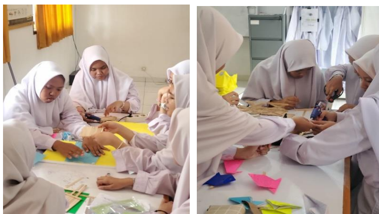
Gambar 3. Pelaksanaan Kegiatan Pembelajaran Siklus