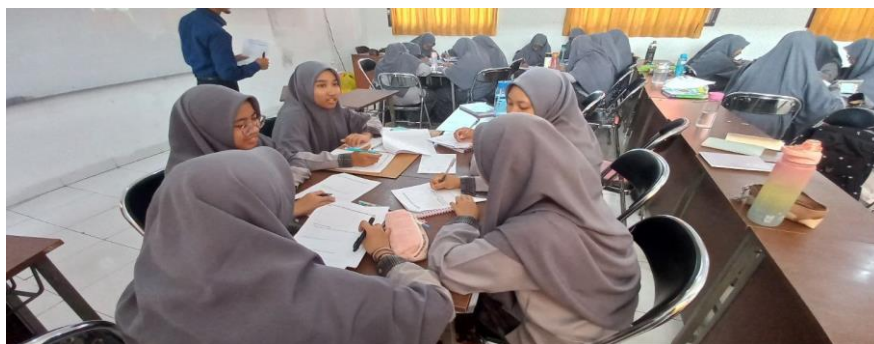
Gambar 1. Pelaksanaan Kegiatan Pembelajaran Siklus I