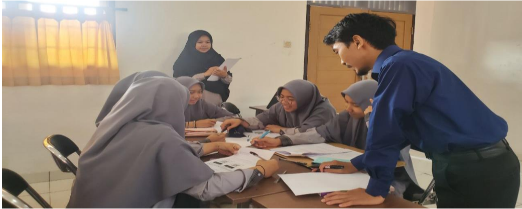
Gambar 2. Pelaksanaan Observasi

Pada tahap ini observer melakukan pengamatan secara langsung terhadap aktivitas belajar siswa dengan memperhatikan tingkah laku siswa selama berlangsungnya pembelajaran Fisika materi Hukum Pascal subtema Fluida Statis mengenai tekanan hidrostatis.