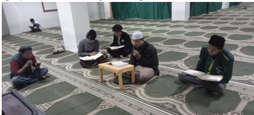
Gambar 2 Kegiatan Kelompok Studi Al Qur'an Mahasiswa di Masjid Kampus

Disamping itu, ada pula beberapa kegiatan mahasiswa sebagai implementasi pembelajaran agama Islam. Kegiatan keagamaan, seperti kelompok studi Al-Quran, kajian hadis, dan diskusi keagamaan, memberikan kesempatan kepada mahasiswa untuk memahami ajaran Islam secara mendalam. Hal ini dapat membantu mereka memperkuat identitas keagamaan, sehingga saat menjalani mata kuliah pendidikan agama Islam, mahasiswa dapat lebih terbuka dan responsif terhadap materi yang diajarkan. Melalui kegiatan keagamaan, mahasiswa dapat mengaplikasikan nilai-nilai agama Islam dalam kehidupan sehari-hari di kampus. Misalnya, melalui kegiatan sosial seperti pengabdian masyarakat, mahasiswa dapat menerapkan nilai-nilai kebaikan, keadilan, dan empati yang diajarkan dalam mata kuliah pendidikan agama Islam.