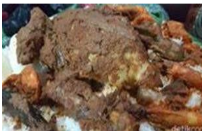
Gambar 4. Manuk (Ayam)

Dalam tradisi Mangupa menurut adat suku Mandailing, ayam yang dimasak haruslah ayam kampung, bukan ayam lainnya. Karena menurut para leluhur, memelihara ayam kampung memiliki nilai edukasi yang baik. Ayam merupakan salah satu hewan yang mengingatkan manusia untuk selalu bangun di pagi hari, melaksanakan sholat subuh dan mencari kebahagiaan. Ayam yang disediakan sebagai bahan pangupa adalah ayam kampung. Ayam digunakan untuk berbagai macam penyakit seperti stroke, kanker dan lain-lain. Ayam menjadi syarat terpenting dalam tradisi ini karena ayam melambangkan harapan untuk proses penyembuhan penyakit dan dipersembahkan kepada jiwa Tondi (roh) agar jiwa Tondi merasakan harapan bahwa roh tersebut akan kembali ke raganya.