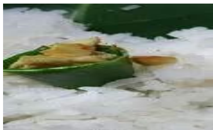
Gambar 7. Sipade (Jahe)

Jahe juga ditempatkan di dalam daun pisang berbentuk kerucut. Jahe ditancapkan ke dalam nasi di tengah-tengah tiga butir telur. Jahe adalah simbol kehangatan. Rasa jahe yang pedas dan hangat dapat menghangatkan tubuh yang sedang sakit.