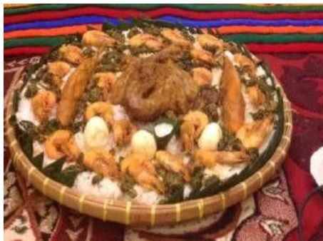
Gambar 9. Anduri