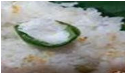
Gambar 6. Sira (Garam)