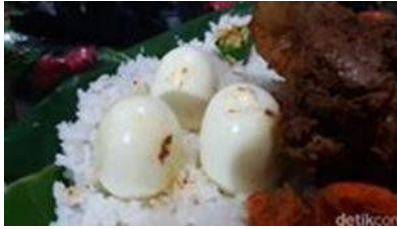
Gambar 3. Pira Ni Manuk (Telur Ayam)