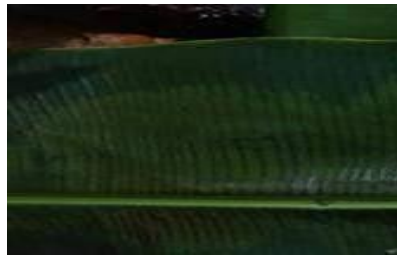
Gambar 8. Bulung Ujung Pisang (Daun Pisang)

Dalam tradisi Mangupa, daun pisang digunakan sebagai alas dan penutup bahan pangupa. Dalam tradisi Mangupa, dibutuhkan tiga lembar daun pisang. Dua daun pisang digunakan sebagai alas untuk bahan pangupa dan satu daun pisang diletakkan di atas sebagai penutup bahan pangupa. Tiga lembar daun pisang melambangkan kekerabatan (Dalihan Na Tolu). Hal ini membuktikan bahwa acara ini didukung oleh tiga unsur Dalihan Na Tolu, yaitu Mora, Kahanggi dan Anak Boru.