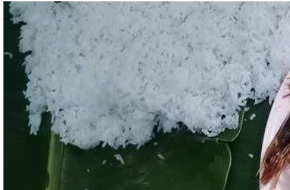
Gambar 2. Indahan (Nasi Putih)