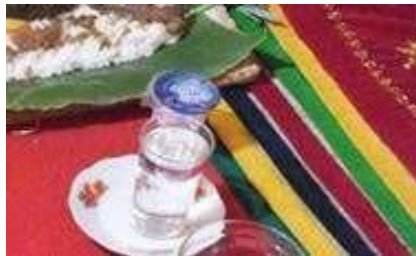
Gambar 5. Aek Minum (Air Minum)

Aek Minum adalah air mineral. Aek Minum adalah cairan yang sangat jernih dan dipercaya dapat menghilangkan dahaga untuk menjaga semangat dalam menjalani aktivitas selanjutnya. Aek Minum melambangkan ketulusan. Warna air yang jernih melambangkan ketulusan karena ketika Anda melakukan sesuatu, Anda harus melakukannya dengan hati yang murni dan tulus agar mendapat berkah dan manfaatnya juga diberkati.