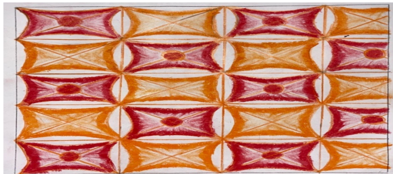
Gambar 3. Hasil Karya Gambar S16

Contoh karya siswa S16 yang memiliki kemampuan menggambar dengan menggunakan unsur dekoratif, kelancaran dalam mewarnai dan kemampuan menggambar dengan rapi dan bersih.