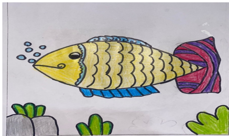
Gambar 1. Hasil Karya Gambar S12

Sebagai contoh karya siswa S12 yang mampu menciptakan sesuatu dari hasil pemikirannya sendiri dan kemampuan untuk menggambar sesuai bentuk aslinya.