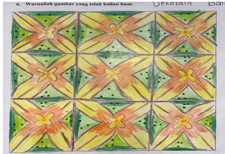
Gambar 4. Hasil Karya Gambar S3