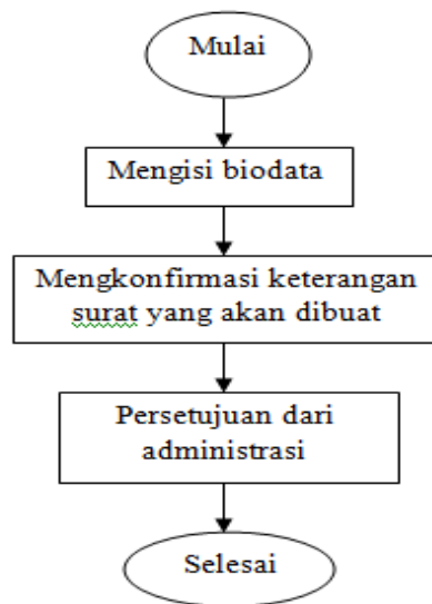
Gambar 1. Diagram Alir Penelitian

Sistem yang dibuat bisa dilihat pada diagram alir berikut :