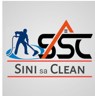
Gambar 1. Logo usaha jasa SINI sa CLEAN

SINI sa CLEAN mempunyai berapa layanan dengan beragam tarif harga yang ditawarkan yaitu: