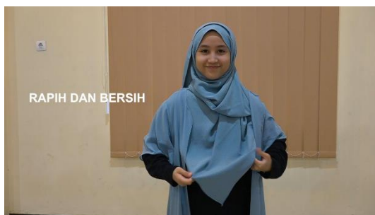
Gambar 8. Ilustrasi akhlaq berpakaian