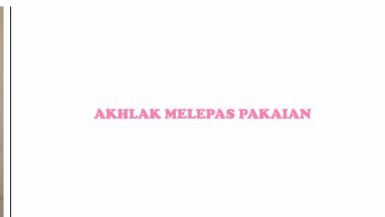
Gambar 9. Materi Akhlak Melepas Pakaian