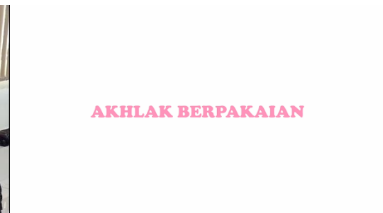
Gambar 5. Masuk Materi Akhlak Berpakaian