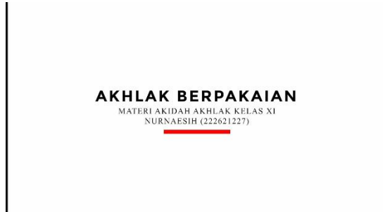
Gambar 2. Opening (Identitas Video)

pengembangan media video pembelajaran materi akhlaq berpakaian yang peneliti ilustrasikan secara garis besar.