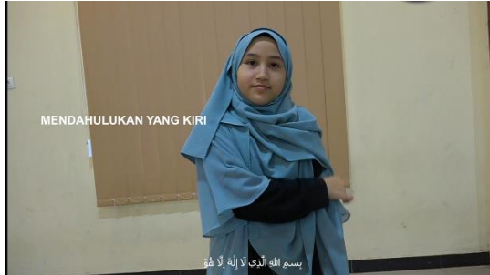
Gambar 10. Do'a dan tutorial ketika melepas pakaian