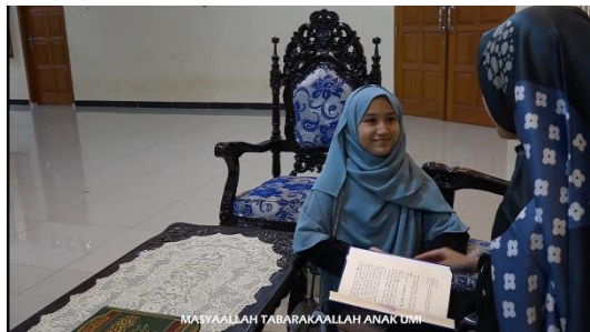
Gambar 14. Penguatan terhadap akhlaq berpakaian yang benar

يٰۤاَيُّهَا اٰدَمُ هٰذَا اَنْزَلْنَا عَلَيْكَ لِبَاسًا يُّؤَيِّدُ سَوَآءِجَكُمْ وَرِيْشًا وَّلِبَاسًا اَلْتَقْوٰى ذٰلِكَ خَيْرٌ ذٰلِكَ مِنْ عَآئِبِ اللّٰهِ لَعَلَّهُمْ يَتَذَكَّرُوْنَ .