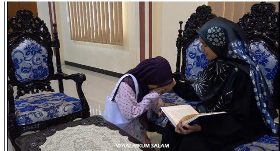
Gambar 3. Perkenalan