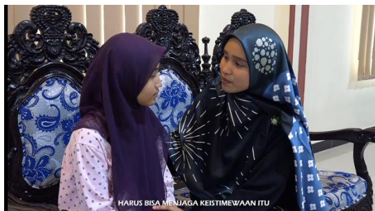
Gambar 4. Problem muncul dan adanya saran perbaikan