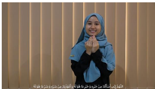
Gambar 6. Do'a ketika berpakaian