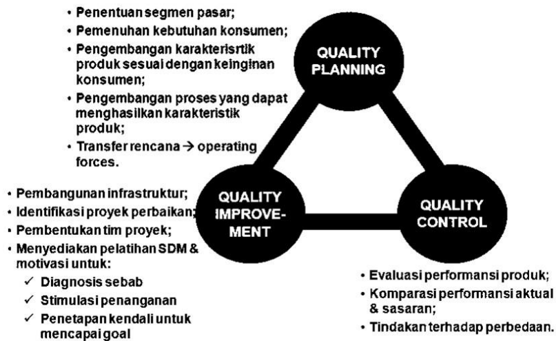
Tabel 2. Teori Trilogi Juran