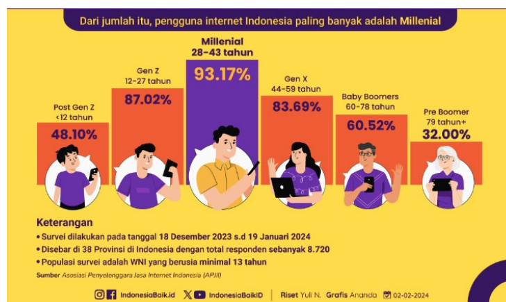
Gambar 2. Usia dan Generasi Pengguna Internet di Indonesia 2023-2024