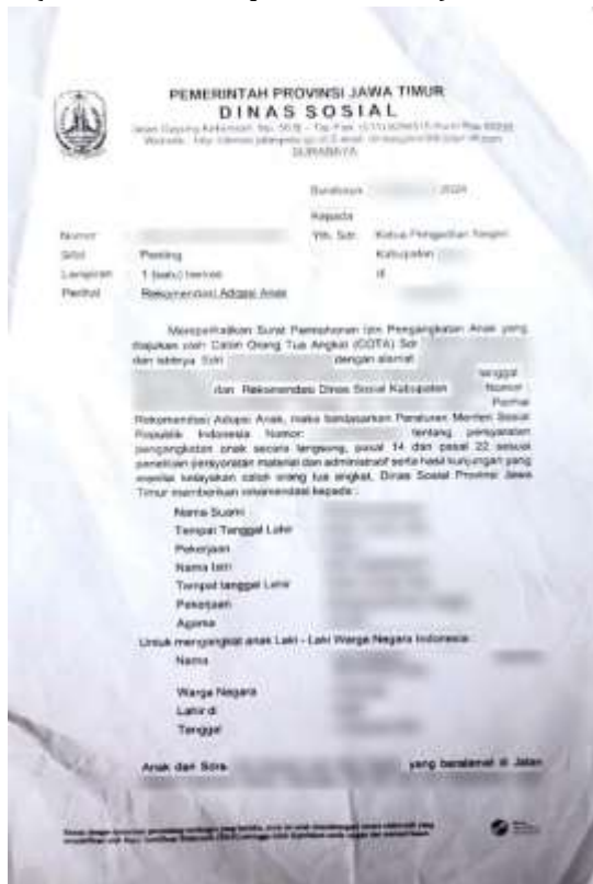
Gambar 6 Surat Rekomendasi

secara langsung (basah) oleh Kepala Dinas Sosial Jawa Timur. Sedangkan Rekomendasi yang diterbitkan, pemberian tanda tangan dilakukan secara elektronik. Untuk penyerahan Surat Keputusan yang sudah terbit, maka dikolektifkan dan diserahkan kepada Kepala Dinas Sosial Jawa Timur dalam kurung waktu seminggu dilakukan 1x (satu kali). Dengan adanya seluruh proses ini dilaksanakan agar dalam mengangkat seorang anak tidak bisa dilakukan dengan sembarangan melainkan harus melalui rentetan proses, persyaratan, dan tahapan yang ada dalam peraturan yang ada di Indonesia (Alfarissa & Puspitasari, 2022).