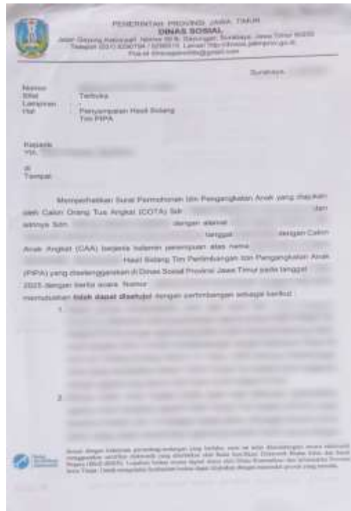
Gambar 4 Surat Pernyataan Tidak Disetujui