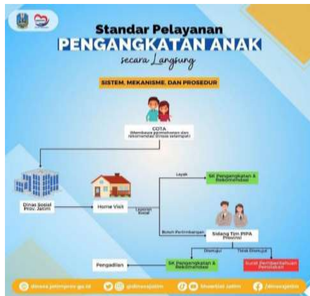
Gambar 1.1 Poster Pengangkatan Anak Secara Langsung Di Jawa Timur

Tabel di atas sebagai bukti bahwa pelaksanaan pengangkatan anak di Jawa Timur tahun 2024 di dominasi melalui proses secara langsung sejumlah 306 anak. Disusul oleh proses pengangkatan anak berdasarkan peraturan sejumlah 3 anak dan tidak ditemukan proses pelaksanaan pengangkatan anak secara adat kebiasaan. Hal ini memperlihatkan bahwa lebih dari setengah jumlah total 329 anak dalam proses pengangkatan anak dilakukan dengan secara langsung. Adapun sistem, mekanisme, dan prosedur pengangkatan anak secara langsung di Jawa Timur yaitu seperti gambar berikut :