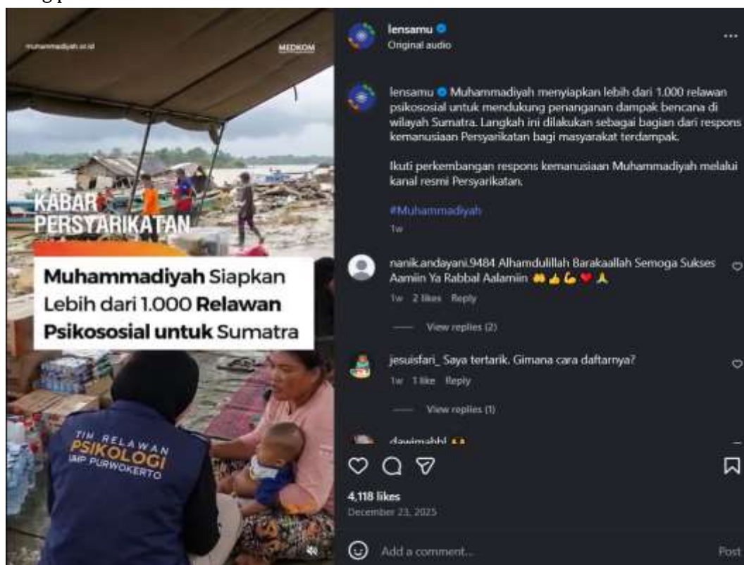
Gambar 2. Representasi Kegiatan Sosial

Pada tingkat denotatif, unggahan @LensaMu juga secara konsisten merepresentasikan berbagai aktivitas sosial dan kemanusiaan, seperti kegiatan bakti sosial, distribusi bantuan, donor darah, kerja sukarela, serta kegiatan pendidikan dan pengabdian masyarakat. Visual-visual ini menampilkan interaksi langsung antara relawan dan masyarakat penerima manfaat, dengan penekanan pada kerja kolektif, kebersamaan, dan kepedulian sosial. Kehadiran tubuh, gestur, dan ekspresi dalam visual tersebut memperkuat kesan bahwa dakwah tidak hanya berlangsung pada level wacana, tetapi juga diwujudkan dalam tindakan nyata di ruang publik.