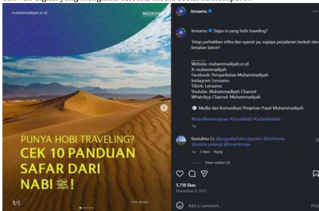
Gambar 1. Dakwah Visual Religiusitas Modern

Pada tingkat denotatif, unggahan-unggahan @LensaMu secara dominan menampilkan desain visual yang bersih, sederhana, dan terkontrol. Penggunaan palet warna lembut seperti biru dan putih, tipografi sans-serif yang modern, serta komposisi visual yang simetris membentuk kesan profesional dan rapi. Visual sering kali menampilkan figur anak muda, aktivitas komunitas, serta latar ruang urban atau semi-urban yang merepresentasikan kehidupan sehari-hari masyarakat modern. Elemen-elemen tersebut menghadirkan citra dakwah yang berbeda dari representasi dakwah konvensional yang identik dengan teks panjang atau simbol religius yang padat, sehingga menjadikan konten @LensaMu mudah dikenali sebagai dakwah digital yang mengikuti estetika media sosial kontemporer.