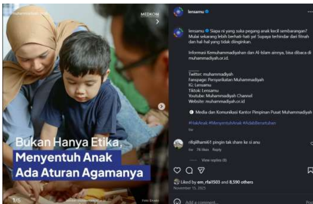
Gambar 4. Edukasi Pembelajaran mikro]

Pada tingkat denotatif, unggahan @LensaMu juga mencakup konten pembelajaran mikro, seperti kutipan nilai keislaman, pengingat moral singkat, infografis edukatif, serta video pendek yang menyampaikan pesan agama secara ringkas. Konten-konten ini dirancang untuk konsumsi cepat dan berulang, sesuai dengan karakteristik penggunaan Instagram sebagai media visual yang bersifat instan dan fragmentaris.