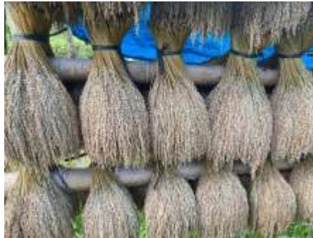
Gambar 1. Ikat Pocong Padi

Setelah panen, padi disimpan dengan rapi di dalam leuit yang menjadi tempat menjaga cadangan pangan keluarga. Biasanya, setiap keluarga memiliki satu hingga beberapa leuit yang mampu menampung sekitar 100-300 pocong (ikat) padi. Hal ini melambangkan kemandirian pangan warga Kampung Nyompok.