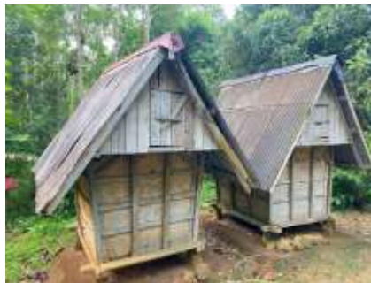
Gambar 2. Bangunan Leuit

Umumnya, lokasi leuit didirikan terpisah dari rumah tinggal dengan tujuan agar apabila terjadi bencana di pemukiman, keberadaan leuit tetap terjaga sehingga masyarakat masih memiliki cadangan pangan. Namun, seiring perkembangan waktu, sebagian besar warga mulai meninggalkan penggunaan leuit dan beralih menyimpan padi pada guah , yaitu ruang atau gudang penyimpanan yang berada di dalam rumah.