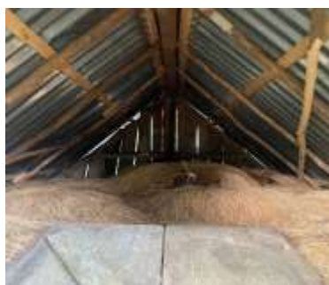
Gambar 3. Padi dalam Leuit

Leuit berfungsi sebagai penopang swasembada pangan dengan cara menjaga ketersediaan beras sepanjang tahun, bahkan dalam jangka waktu empat hingga lima tahun. Hal ini memberikan stabilitas bagi masyarakat dalam menghadapi ketidakpastian, baik karena faktor alam, krisis ekonomi, maupun fluktuasi harga pangan. Dengan demikian, leuit tidak hanya menjadi simbol budaya, tetapi juga instrumen ketahanan pangan yang nyata.