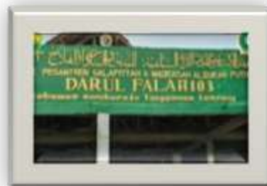
Gambar 4., Berdirinya Pondok Pesantren Darul Falah Cabang