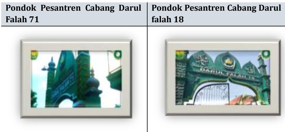
Gambar 3., Berdirinya Pondok Pesantren Darul Falah Cabang

pernikahan massal santri yakni untuk menyalurkan, menyiarkan serta mengamalkan ilmu-ilmu agama islam dengan cara mendirikan Pondok Pesantren cabang yang syarat utamanya untuk ikut serta menjadi pendiri Pondok Pesantren Cabang adalah mengikuti pernikahan massal tersebut. Alasan demikian, diharapkan santri yang telah mendapatkan ilmu yang diberikan oleh pengasuh dapat di amalkan serta disebarluaskan kepada kalangan masyarakat luas. Keberhasilan kyai atas terwujudnya pernikahan massal yakni terbentuknya keluarga yang sakinah dari keluarga santri yang mengikuti pernkahan massal. Adapun keberhasilan yang menjadi titik fokus dalam penulisan ini yakni telah terbentuknya beberapa Pondok Pesantren Cabang yang tersebar di wilayah Indonesia sehingga pernikahan massal santri tersebut akan terus-menerus untuk dilaksanakan dan telah menjadi sebuah tradisi yang mutlak di kalangan Pondok Pesantren Darul Falah Pusat. Adapun yang telah tercatat Pondok pesantren Darul Falah Pusat telah memiliki Pondok Pesantren Cabang Darul Falah sebanyak 208 cabang yang berada di pulau jawa, sumatra, dan kalimantan. Maka penulis akan memberikan sedikit gambaran mengenai keberhasilan berdirinya Pondok Pesantren Cabang Darul Falah sebagai berikut (HI, personal communication, 2026; SB, personal communication, 2006).