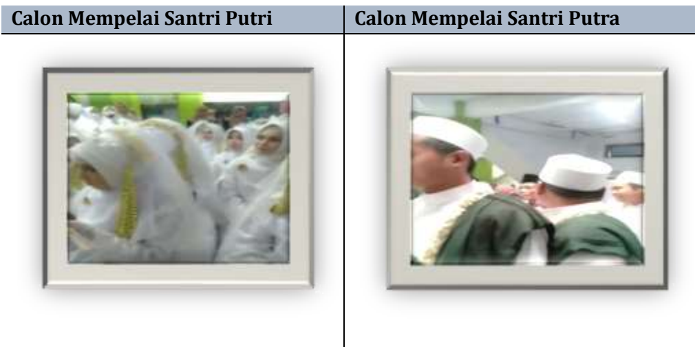
Gambar 2., Prosesi Pernikahan Massal Para Santri Putra dan Santri Putri Di Pondok Pesantren Darul Falah Pusat

Suatu alasan santri putra maupun santri putri untuk berpartisipasi dalam mengikuti pernikahan massal merupakan keinginan untuk turut serta dengan tujuan untuk memajukan Pondok Pesantren melalui pernikahan massal yang nantinya akan mendirikan Pondok Pesantren Cabang di wilayah Indonesia. Di samping itu, sebuah dukungan dari orang tua yang menginginkan untuk menjadi generasi penerus Pondok Pesantren Cabang yang telah ada dan untuk mendirikan Pondok Pesantren Cabang seterusnya yang sesuai dengan urutan nomor akhir Pondok Pesantren Cabang didirikan. Alasan lain yang lebih mendasar para santri putra dan santri putri dalam berpartisipasi untuk mengikuti pernikahan massal merupakan bentuk keta'dziman, ketaatan serta keridloan seorang santri dengan Kyai (AH & RJ, personal communication, 2026; AR & LB, personal communication, 2026; BH & FA, personal communication, 2026; MR & SA, personal communication, 2026).