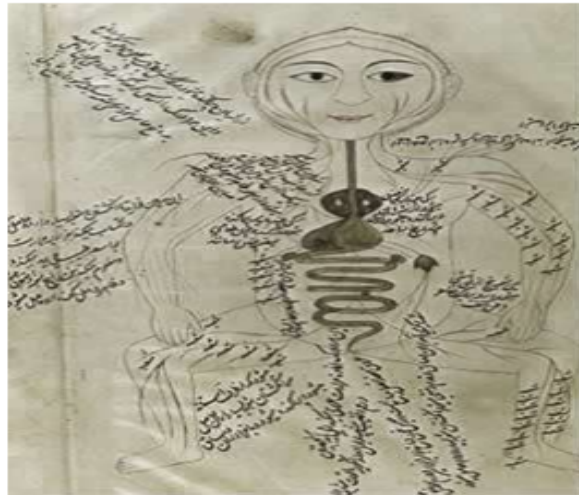
Gambar 1. Teori Struktur Manusia Menurut Ibn Sina

Kesempurnaan potensi jismiyah dan ruhiyah yang dimiliki oleh manusia telah digambarkan oleh Ibnu Sina melalui gambar berikut: