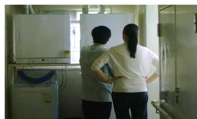
Gambar 9: Cara penggunaan mesin cuci menit ke: 50:50