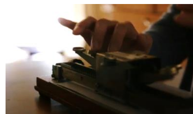
Gambar 4 : Reiko belajar mengetik huruf braille