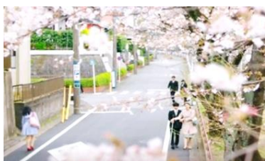
Gambar 3: Satoshi melanjutkan sekolah di tingkat universitas