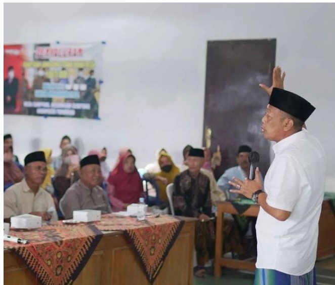
Gambar 1. Dokumentasi sosialisasi Bupati Ponorogo Kepada Masyarakat Sampung

Selanjutnya pemerintah sudah melaksanakan komunikasi secara langsung dengan menggandeng para tokoh desa seperti kepala desa dan kepala Camat Sampung untuk membantu dalam komunikasi dengan masyarakat secara langsung. Namun dalam pelaksanaan komunikasi dengan masyarakat masih minim dilakukan oleh pemerintah oleh sebab itu masih adanya penolakan dari Masyarakat yang mata pencahariannya hilang dikarenakan Pembangunan monumen reog ini, mereka menolak dikarenakan belum adanya pemberitahuan dari pemerintah sehingga belum adanya koordinasi secara langsung.